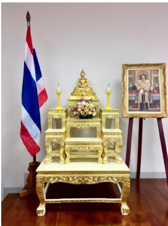
ภาพ การจัดโต๊ะหมู่ในห้องประชุม.