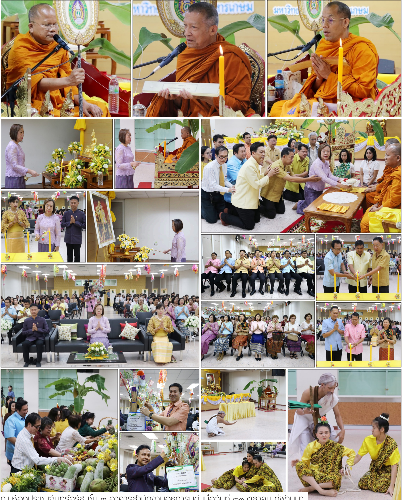
ณ ห้องประชุมจันทร์จรัส ชั้น ๓ อาคารสำนักงานอธิการบดี เมื่อวันที่ ๓๑ ตุลาคม ที่ผ่านมา