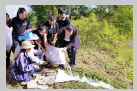
อนุรักษ : พศ.อส.สทพวส ทวธอธวาลน พุฒอานวย การศูนยการศีกษาฯ จันทรเกษม-ชยนาท เปนปรธาน เปดครงการอนุรักษศูกคลอง แลรอมปลอยปลา ปลุก ตบไม รอมกับคนคาจารย เจาหนาที่ แลนบคศึกษา ณ ศูนยการศีกษาฯ จันทรเกษมชยนาท เมือเรื่อ ๆ นี้