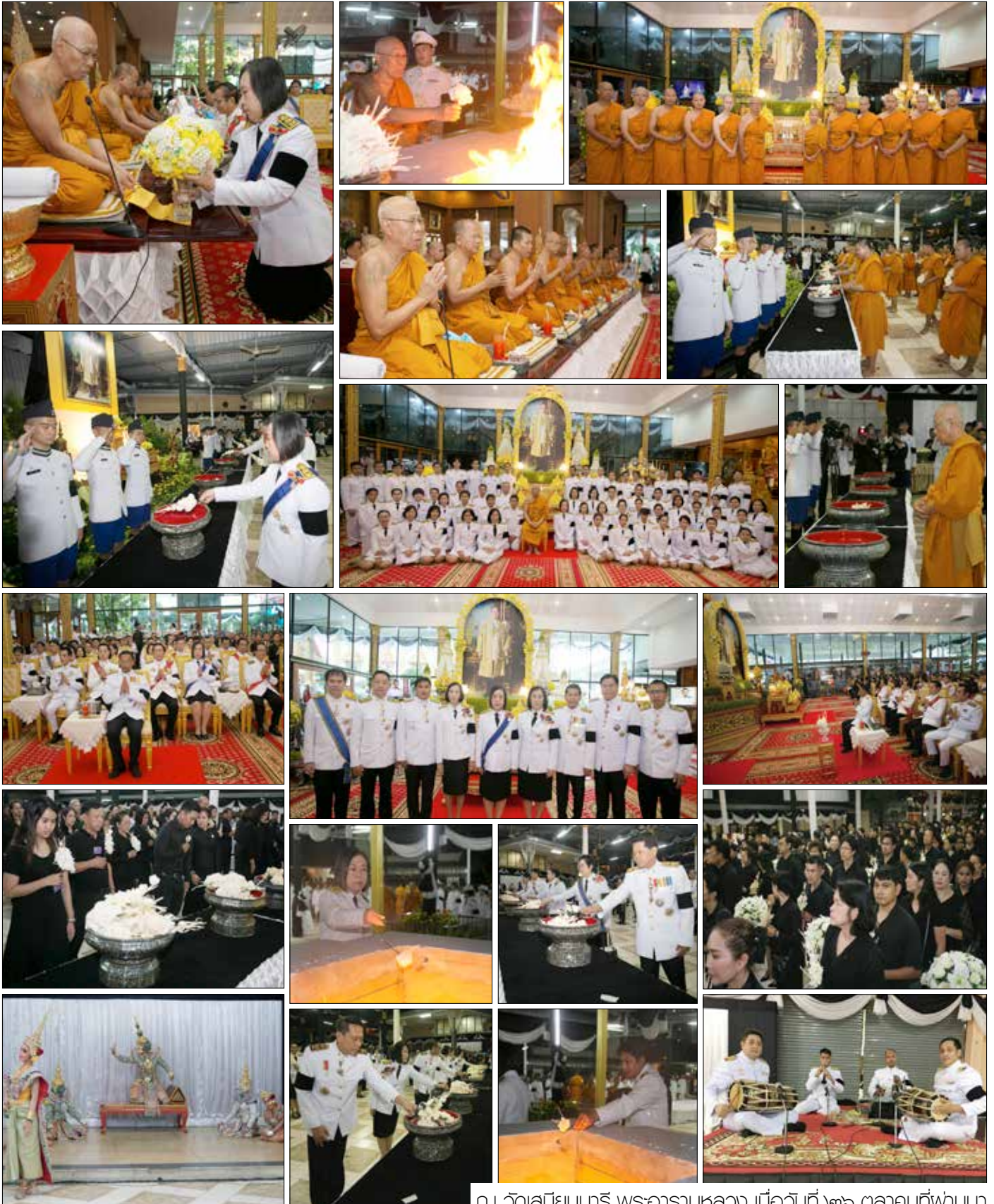
ณ วัดเสถียรนารี พระอารามหลวง เมื่อวันที่ ๓๐ ตุลาคมที่ผ่านมา