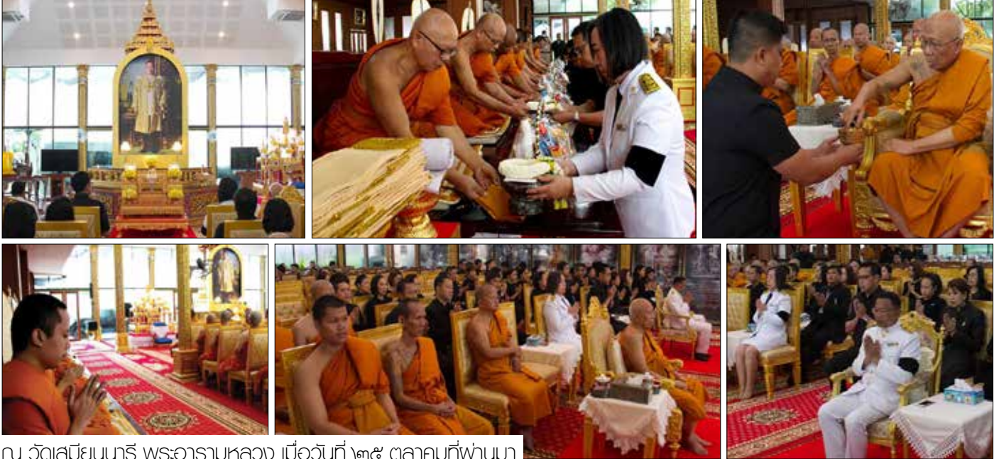
ณ วัดเสมียนนารี พระอารามหลวง เมื่อวันที่ ๒๕ ตุลาคมที่ผ่านมา