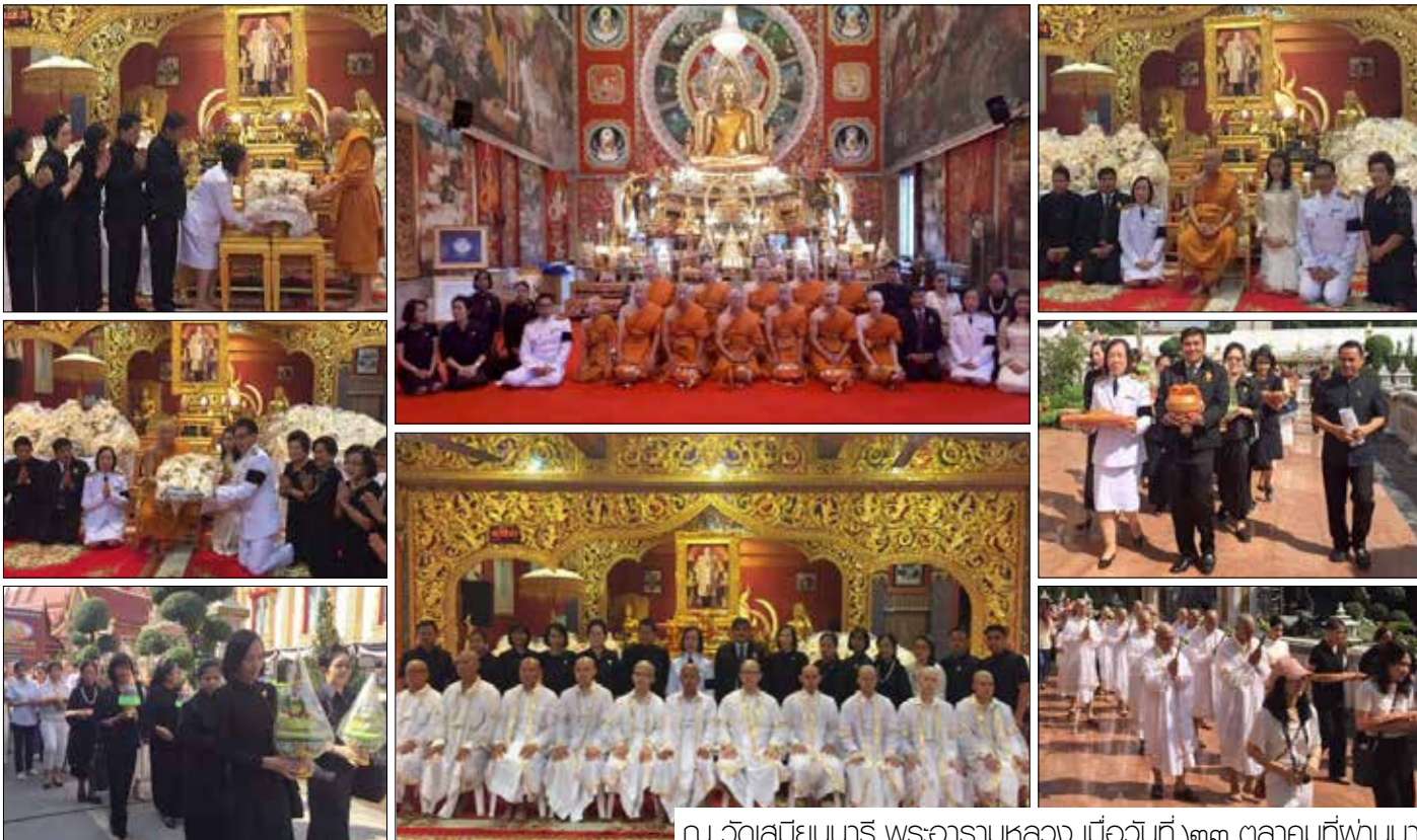
ณ วัดเสมียนนารี พระอารามหลวง เมื่อวันที่ ๒๓ ตุลาคมที่ผ่านมา