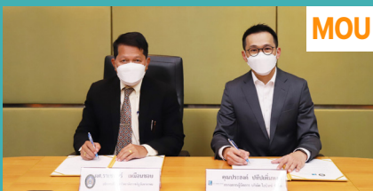
คณะวิทยาศาสตร์ จัดพิธีลงนามบันทึกข้อตกลงความร่วมมือทางวิชาการ ระหว่าง มหาวิทยาลัยราชภัฏจันทรเกษม กับ บริษัท ไอบิทซ์ จำกัด เพื่อการพัฒนาหลักสูตรวิทยาศาสตร์บัณฑิต สาขาวิชาการจัดการสิ่งแวดล้อมและความปลอดภัย ณ ห้องประชุมบรรจบ พันธุเมธา ชั้น 4 อาคารสำนักงาน อธิการบดี เมื่อเร็ว ๆ นี้

ประธานสาขาวิชาฯ กล่าวต่อว่า การพัฒนาหลักสูตรครั้งนี้ ที่เน้นองค์ความรู้ ควบคู่ไปกับการฝึกปฏิบัติจริง ทั้งภาคทฤษฎี และปฏิบัติจากสถานประกอบการจริง ยังจะช่วยลดปัญหาการว่างงานของ นักศึกษา หรือการทำงานที่ไม่ตรงกับสายที่ เรียนมาได้ ถือเป็นอีกก้าวสำคัญที่สาขาจะ ก้าวเข้าสู่หน้าการศึกษายุคใหม่ ที่ “เรียนกับ ตัวจริง ประสบการณ์จริง ลงมือปฏิบัติจริง”