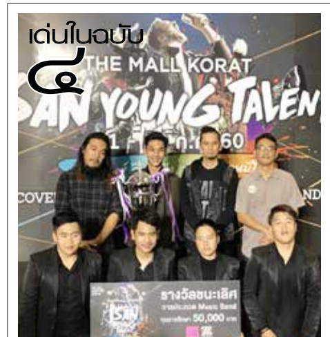
นศ. ดนตรีสากล สุดจั่ง นำความรู้ผ่านเสียงเพลง คว้ารางวัลพระราชทานมาครอง