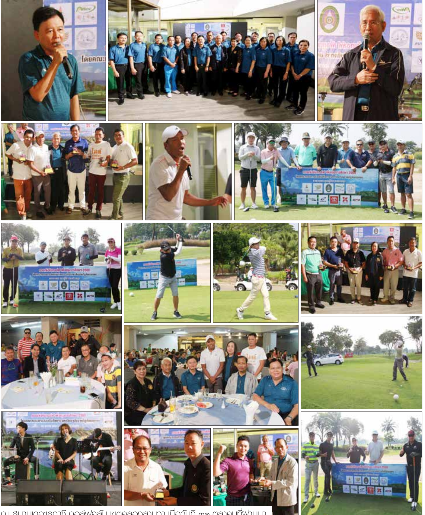
ณ สนามเดอะลาซซ์ กอล์ฟคลับ เขตคลองสามวา เมื่อวันที่ ๓๑ ตุลาคมที่ผ่านมา