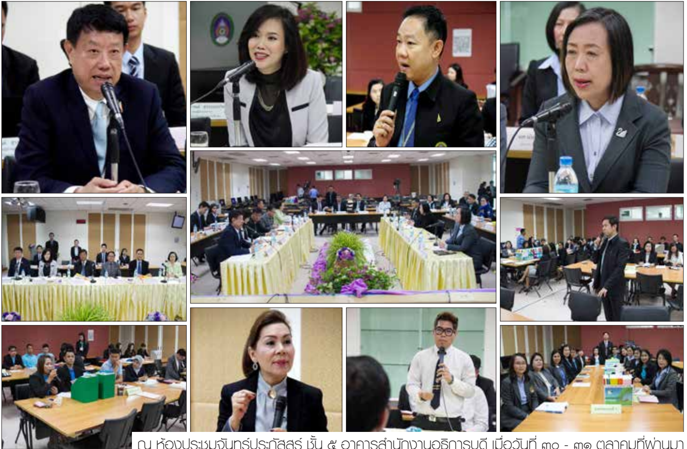
ณ ห้องประชุมจันทร์ประภัสสร ชั้น ๕ อาคารสำนักงานอธิการบดี เมื่อวันที่ ๓๐ - ๓๑ ตุลาคมที่ผ่านมา