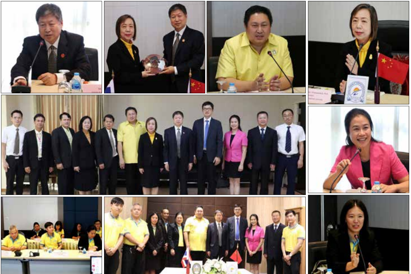
ณ ห้องประชุมชั้น ๓ อาคารนวัตกรรม และห้องประชุมมานิจมุลาย ชั้น ๔ อาคารสำนักงานอธิการบดี เมื่อวันที่ ๒๙ ตุลาคม ที่ผ่านมา