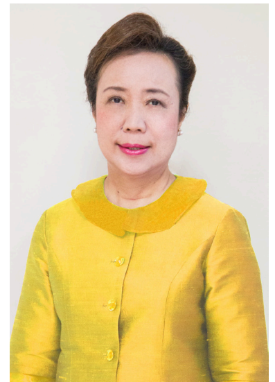
รองศาสตราจารย์ ดร.สุมาลี ไชยศุภรากุล อธิการบดี

ขอให้ทุกท่านได้รับพระบารมีของพระองค์ท่านเป็นพรอันประเสริฐเป็นมงคลในวันสำคัญนี้.