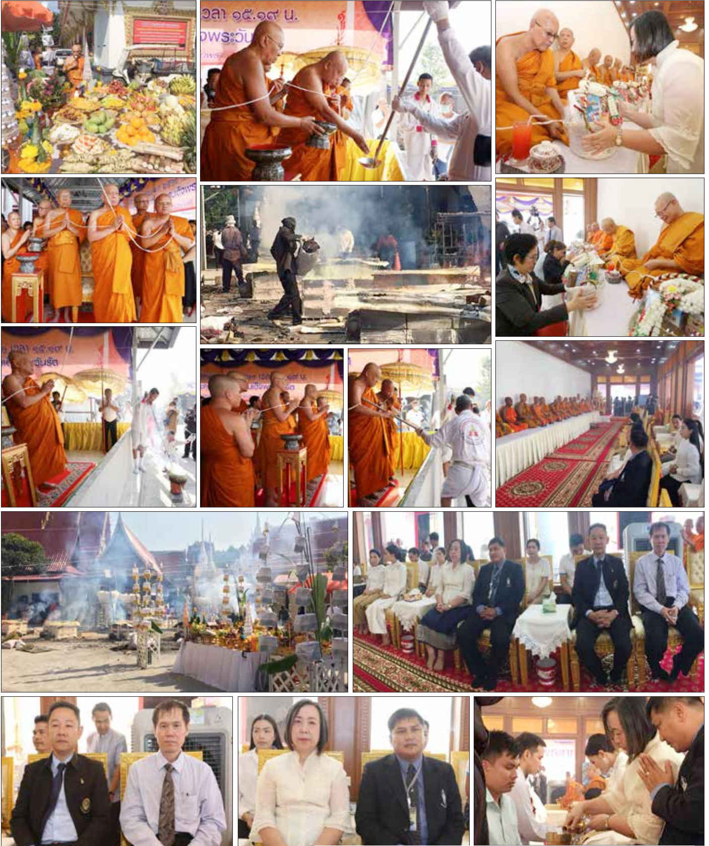
ณ วัดเสขียนนารี พระอารามหลวง เมื่อวันที่ ๓ พฤศจิกายน ที่ผ่านมา