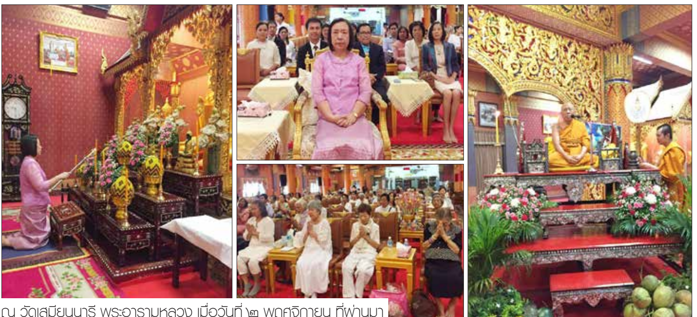
ณ วัดสมิณนารี พระอารามหลวง เมื่อวันที่ ๒ พฤศจิกายน ที่ผ่านมา