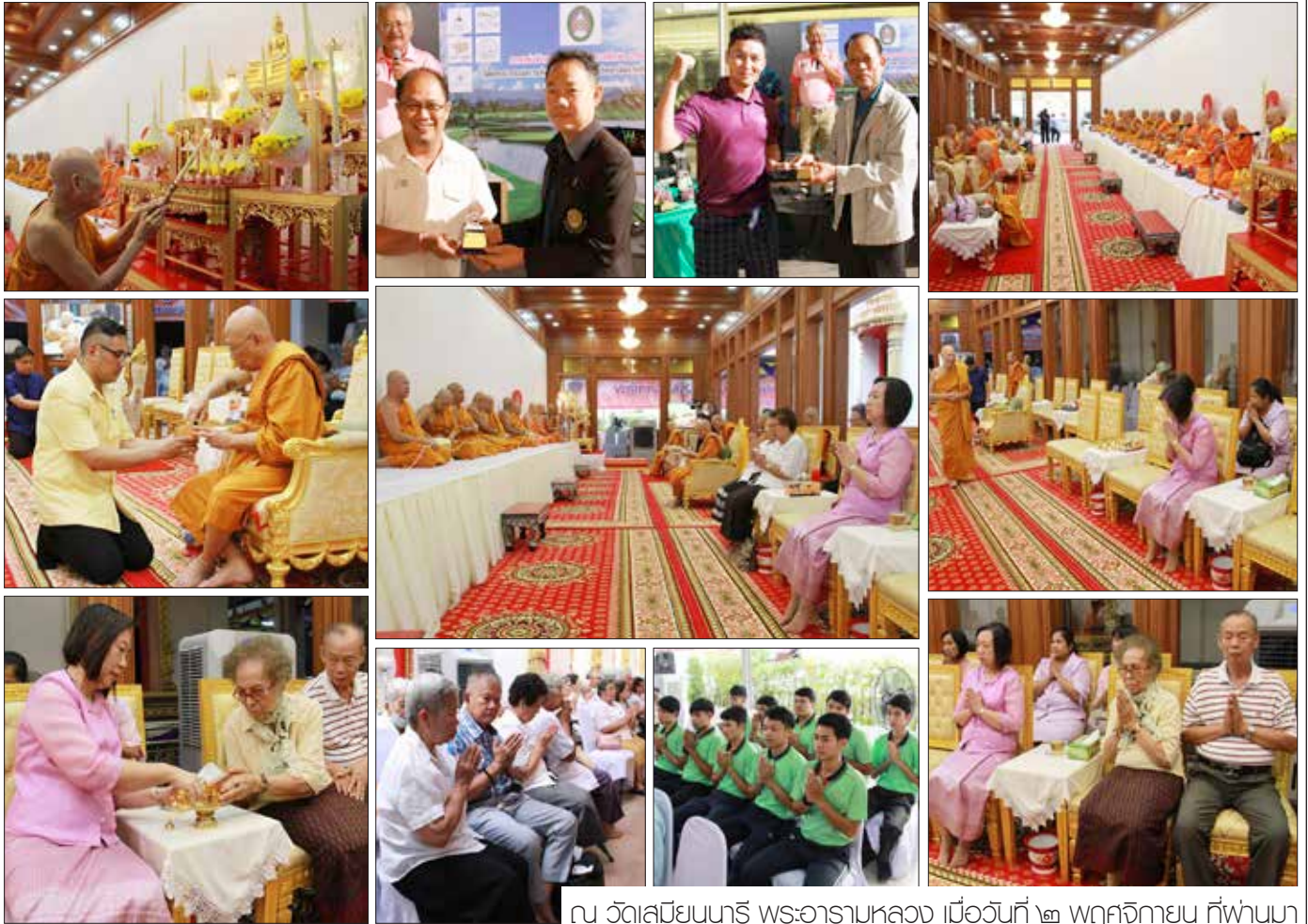
ณ วัดสมิณนารี พระอารามหลวง เมื่อวันที่ ๒ พฤศจิกายน ที่ผ่านมา