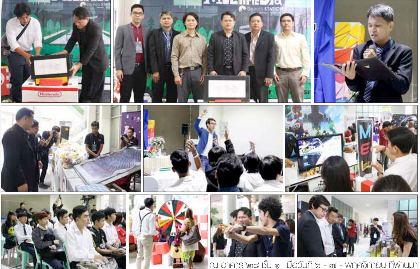
ณ อาคาร ๒๘ ชั้น ๑ เมื่อวันที่ ๖ - ๗ - พฤศจิกายน ที่ผ่านมา