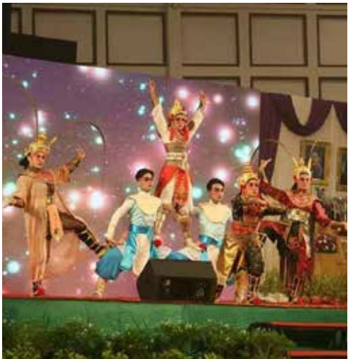
นาฏศิลป์ฯ คว้ารองอันดับ ๑ Thailand Dramatic Festival 2018