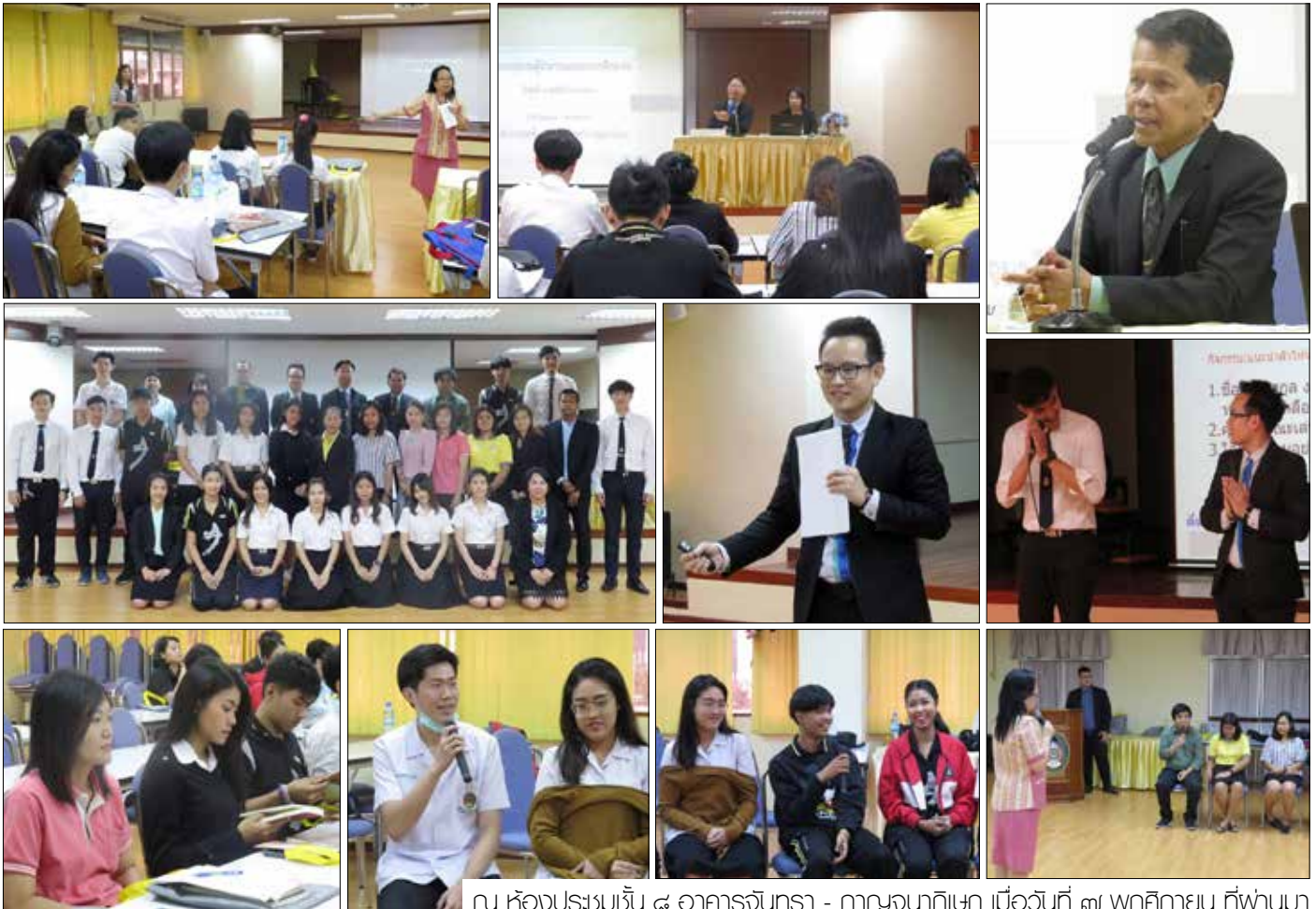
ณ ห้องประชุมชั้น ๘ อาคารจันตรา - ทานจนาภิเษก เมื่อวันที่ ๗ พฤศจิกายน ที่ผ่านมา