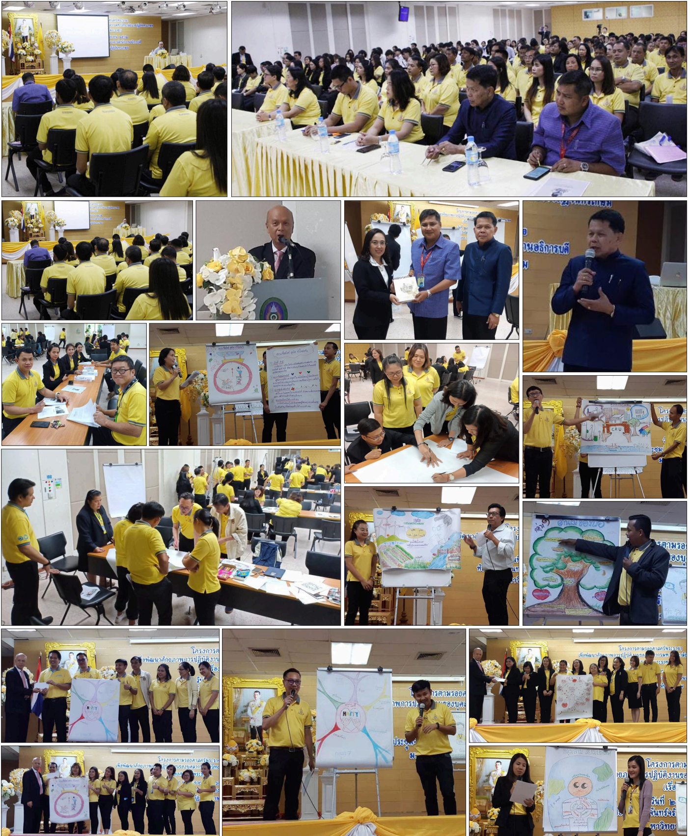
ณ ห้องประชุมจันทร์จรัส ชั้น ๓ อาคารสำนักงานอธิการบดี เมื่อวันที่ ๒๙ พฤศจิกายน ที่ผ่านมา