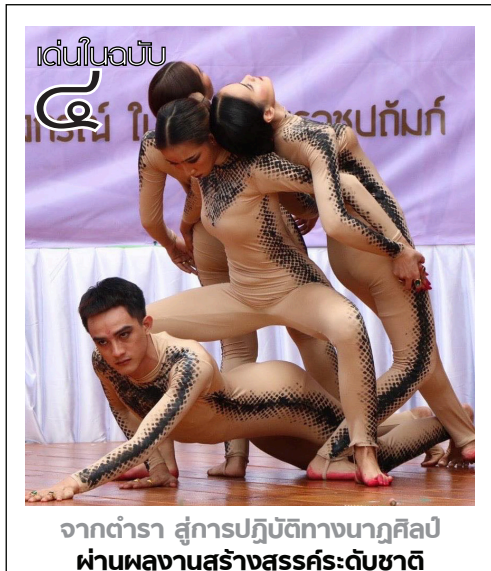
จากตำราสู่การปฏิบัติทางนาฏศิลป์ ผ่านผลงานสร้างสรรค์ระดับชาติ

ประธานโครงการฯ กล่าวว่า อย่างไรก็ตาม การสัมมนาทั้ง ๒ ช่วง มีความเห็นตรงกัน เรื่องการเป็นนักข่าว ควรมีทักษะให้หลากหลายด้านเป็นสิ่งที่ดีที่สุดในยุคปัจจุบัน ทั้งในเรื่องการเขียนคอนเทนต์ โปรแกรมต่าง ๆ ที่ช่วยให้ทำงานได้ง่ายขึ้น ต้องมีความอดทน ขยัน พร้อมที่จะเรียนรู้อยู่เสมอ และเตือนนักข่าวรุ่นใหม่ที่ความอันตรายที่กำลังเข้ามาคือ IA (ปัญญาประดิษฐ์) ที่จะเข้ามาแทนอาชีพในอนาคต