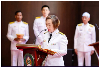
แต่งตั้งอธิการบดี