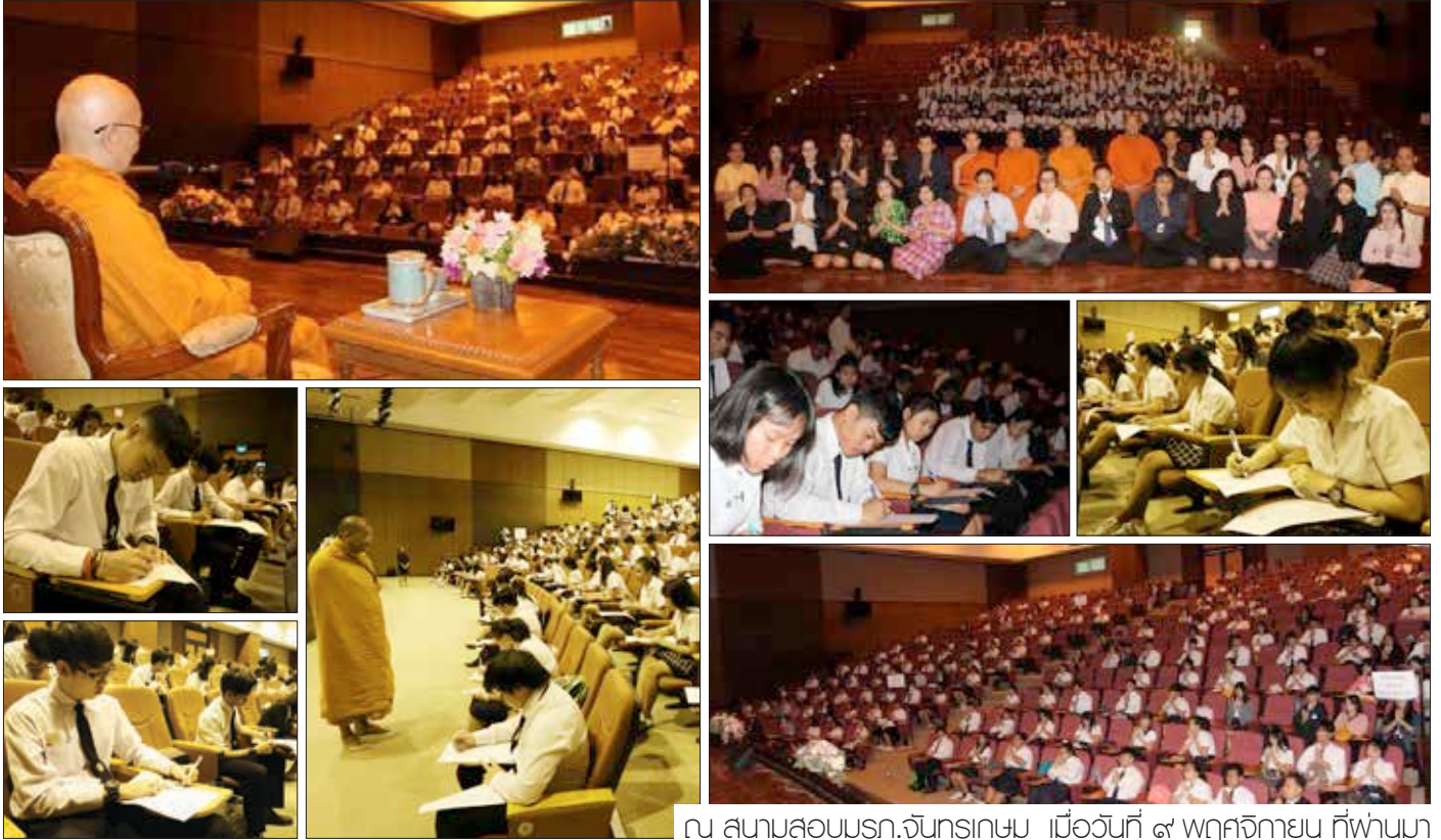
ณ สานามสออบธรร.จันทรกษม เมอวันศึ ๙ พศึจึกายน ศึฟ่านมา