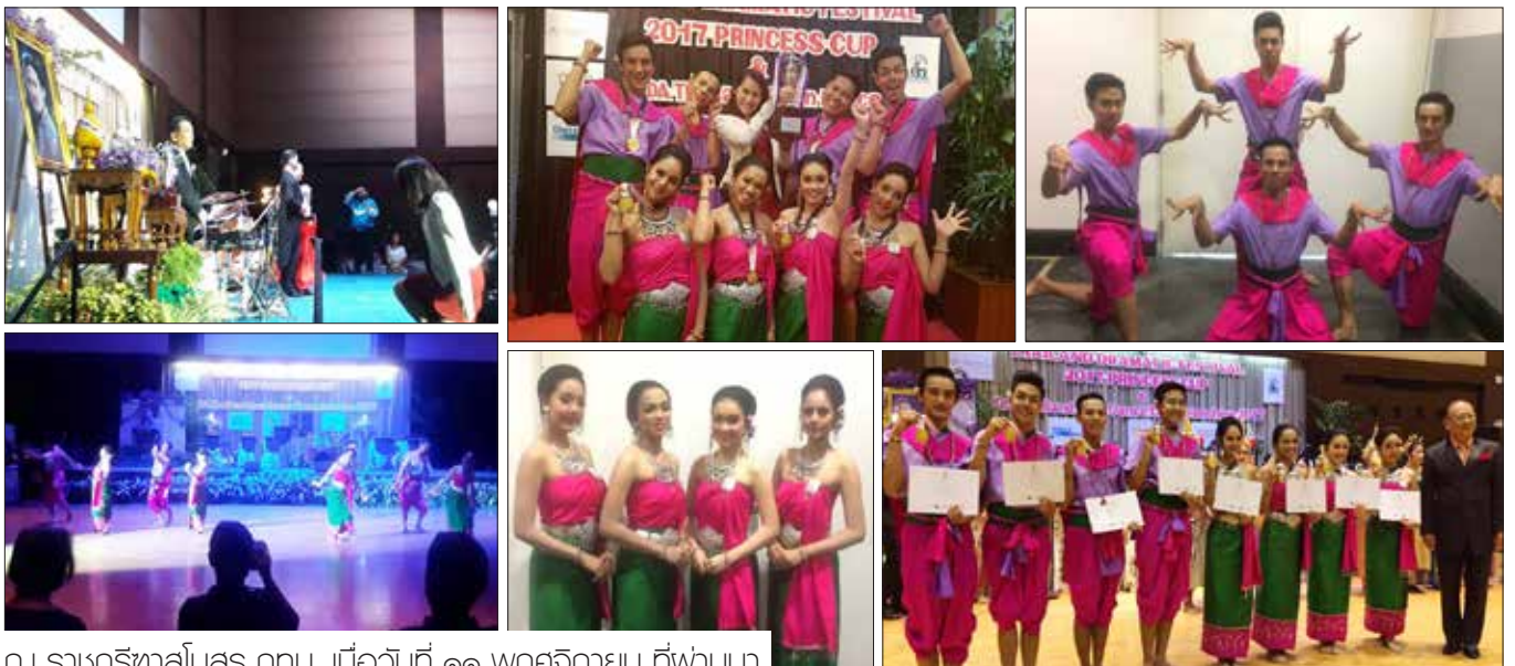
ณ ราชศึรึทาลสมอส กทม. เมอวันศึ ๑๑ พศึจึกายน ศึฟ่านมา