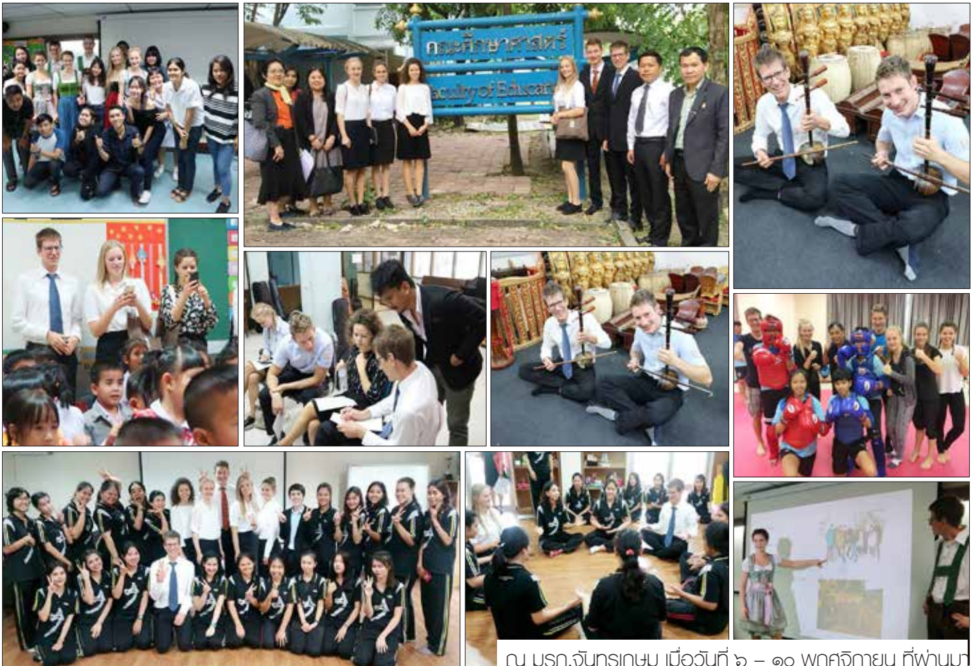
ณ มรท.จันทรเกษม เมื่อวันที่ ๖ - ๑๐ พฤศจิกายน ที่ผ่านม