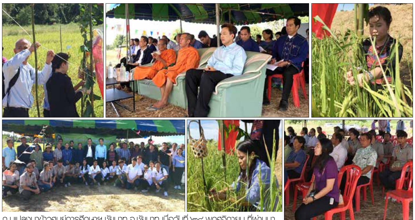
ณ แปลงนาข้าวศูนย์การศึกษาฯ เขียวนาถ จ.เขียวนาถ เมื่อวันที่ ๒๔ พฤศจิกายน ที่พวนมา