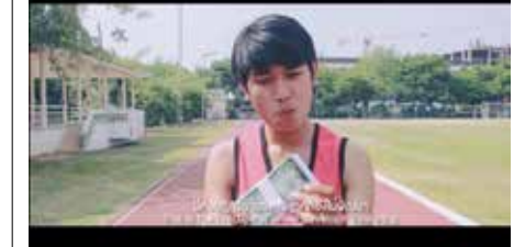
๓ หนุ่บโซวของผ่านสื่อโซขณา ควำรงวัล NACC AWARDS 2017