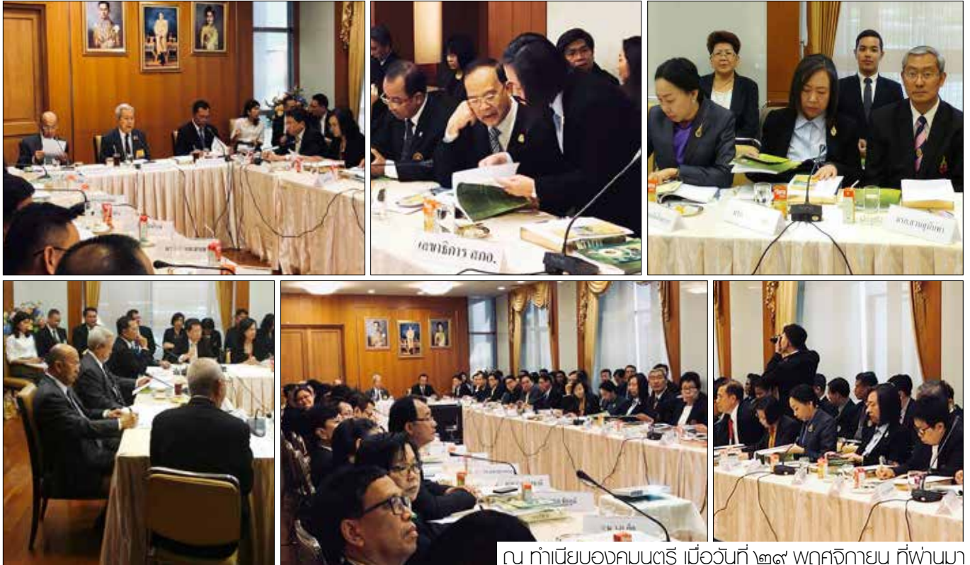
ณ ทำเนียบองคมนตรี เมื่อวันที่ ๒๙ พฤศจิกายน ที่พวนมา