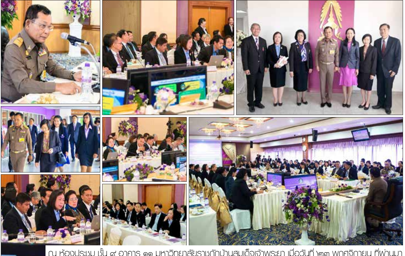
ณ ห้องประชุม ชั้น ๙ อาคาร ๑๑ มหาวิทยาลัยราชภัฏบ้านสมเด็จเจ้าพระยา เมื่อวันที่ ๒๓ พฤศจิกายน ที่ผ่านมา