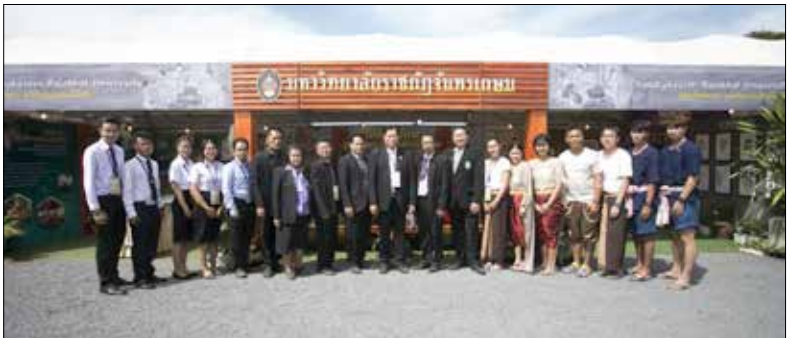
ณ ศูนย์เครือข่ายการเรียนรู้เพื่อภูมิภาคจุฬาลงกรณ์มหาวิทยาลัย จ.สระบุรี เมื่อวันที่ ๒๕ พฤศจิกายน - ๕ ธันวาคม ที่ผ่านมา

บัณฑิตวิทยาลัย ขอเชิญชวนนักศึกษาระดับบัณฑิตศึกษา และผู้ที่มีความสนใจ เข้าร่วมโครงการอบรมเสริมทักษะการจัดทำวิทยานิพนธ์ระดับบัณฑิตศึกษาที่มีคุณภาพ เพื่อประโยชน์ต่อการพัฒนาประเทศในศตวรรษที่ ๒๑ วันเสาร์ที่ ๒๓ ธ.ค. ๖๐ เวลา ๐๘.๓๐ - ๑๖.๓๐ น. จะมีการจัดกิจกรรม “เทคนิควิธีการเขียนบทคัดย่อฉบับภาษาไทยและภาษาอังกฤษอย่างมีคุณภาพ” เพื่อการเสริมสร้างความรู้ ความเข้าใจในการเขียนบทคัดย่อ สนใจติดต่อสอบถามข้อมูลเพิ่มเติม และสำรองที่นั่งได้ที่ เบอร์ ๐ ๒๕๑๓-๖๕๖๘ หรือเบอร์ภายใน ต่อ ๑๕๐๑ และ ๑๕๐๓ ภายในวันที่ ๑๕ ธ.ค. ๖๐ (ด่วนจำนวนจำกัด)