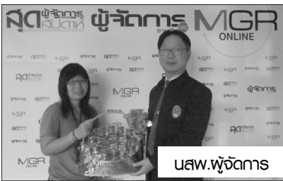
นสว.ผู้จัดการ