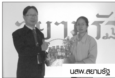
นสว.สยามรัฐ