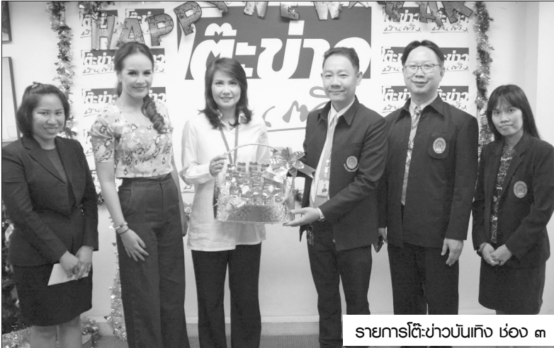
รายการโต๊ะข่าวบันเทิง ช่อง ๓