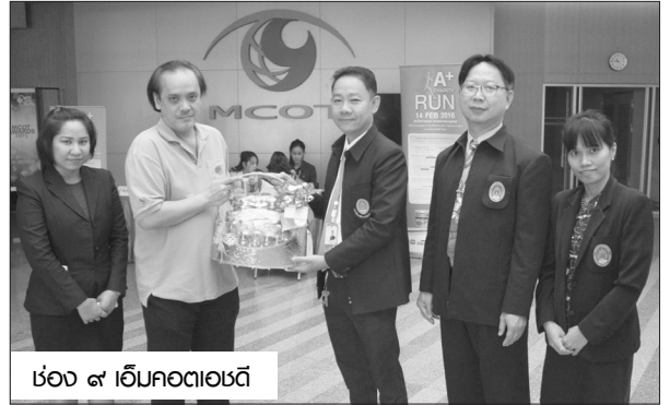
ช่อง ๙ เอ็มคอตเอชดี