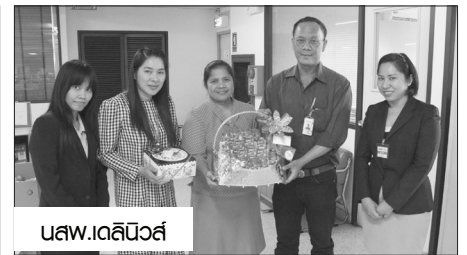
นสว.เดลินิวส์