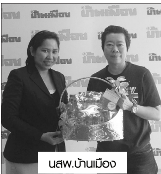
นสว.บ้านเมือง