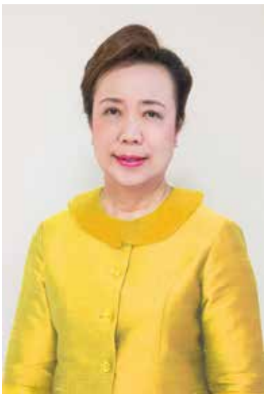
รองศาสตราจารย์ ดร.สุมาลี ไชยสุภารกุล อธิการบดีมหาวิทยาลัยราชภัฏจันทรเกษม

สวัสดิ์ท่านคณาจารย์ บุคลากร นักศึกษา และชาวจันทรเกษมทุกท่าน