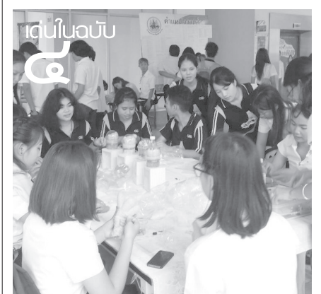
... “นัดพบแรงงาน”... หนุนสร้างรายได้ให้ น.ศ.

ได้แก่ ภาษาอังกฤษ ภาษาชแอมร์ ภาษา ฝรั่งเศส ภาษาจีน และภาษาญี่ปุ่น หลังจากนี้ นักศึกษาเข้ารับการอบรมทางภาษาครบตาม