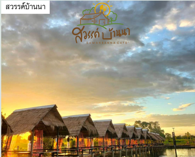
สวรรค์บ้านนา

และมาแวะกันที่ภาคกลางกับกาแฟทวดพัน @ชัยนาท “ร้านกาแฟในชัยนาทที่บรรยากาศดีมากเลย ที่จอดรถกว้างขวาง ภายในร้านมีมุมต่าง ๆ สำหรับคนชอบถ่ายรูป นอกจากเครื่องดื่ม ทางร้านมีบริการอาหารอีกหลายอย่าง ทั้งกาแฟเหมาะสำหรับคอกาแฟอย่างแท้จริง และอีกแก้ว “กาแฟสดทวดพัน” เมนูชิกเนเจอร์ของร้าน สำหรับคนรักความเข้มข้น มีโอกาสก็ลองมาจัดกันนะจ๊ะ”