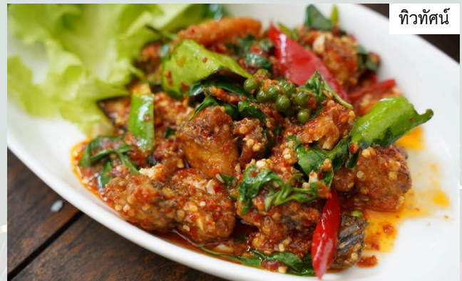
ทิวทัศน์

และมาจบกันในส่วนของภาคใต้กับร้านทิวทัศน์@ไฮเวย์ @พัทลุง “สาขานี้ติดถนนไฮเวย์มีที่จอดรถสะดวกสบาย แคมมีห้องแอร์ไว้คอยให้บริการ เมนูอาหารขึ้นชื่อของร้านจะเป็นอาหารไทยแนวบ้านใต้และเมนูอาหารทะเล อาหารที่น่าสนใจคือ “ยำทิวทัศน์” เหมือนยำรวมมิตร งานใหญ่จัดเต็มให้เยอะมาก หมักสด กุ้งแดง น้ำยำเปรี้ยวอมหวาน และ “ผัดผักทะเลียง” ไบเลียงอ่อนดี รสชาติเค็ม ๆ มัน ๆ กินกับข้าวลงตัว”