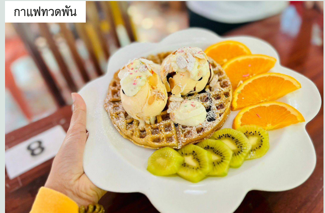
กาแฟทวดพัน

และมาจบกันในส่วนของภาคใต้กับร้านทิวทัศน์@ไฮเวย์ @พัทลุง “สาขานี้ติดถนนไฮเวย์มีที่จอดรถสะดวกสบาย แคมมีห้องแอร์ไว้คอยให้บริการ เมนูอาหารขึ้นชื่อของร้านจะเป็นอาหารไทยแนวบ้านใต้และเมนูอาหารทะเล อาหารที่น่าสนใจคือ “ยำทิวทัศน์” เหมือนยำรวมมิตร งานใหญ่จัดเต็มให้เยอะมาก หมักสด กุ้งแดง น้ำยำเปรี้ยวอมหวาน และ “ผัดผักทะเลียง” ไบเลียงอ่อนดี รสชาติเค็ม ๆ มัน ๆ กินกับข้าวลงตัว”