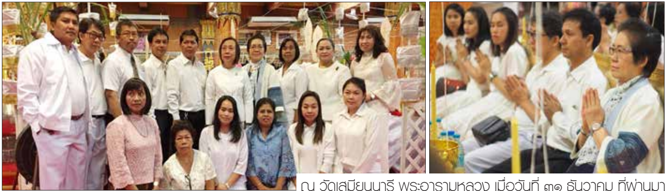
ณ วัดเสถียมนารี พระอารามหลวง เมื่อวันที่ ๓๑ ธันวาคม ที่พวนมา