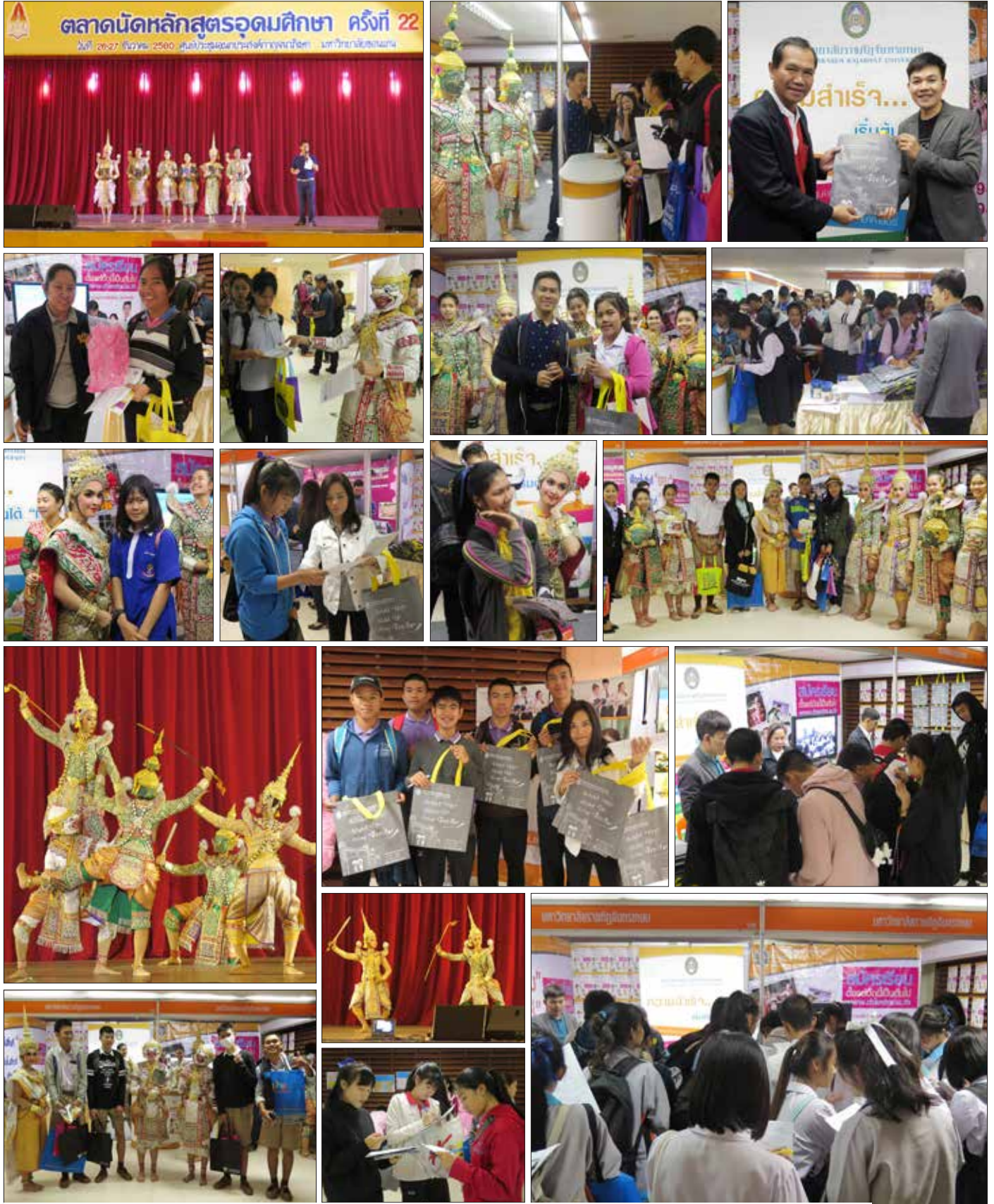
ณ ห้องประชุมเอนกประสงค์ ทาณอนาภิเขต มหาวิทยาลัยขอนแก่น เมื่อวันที่ ๒๖ - ๒๗ มกราคม ที่ฟ่านมา