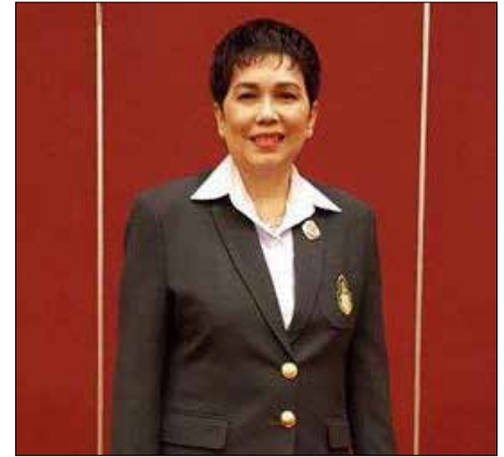
“ความโดดเด่นต่อไป” นายกสมาคมฯ กล่าว “โฉมใหม่ของสมาคมศิษย์เก่ามหาวิทยาลัยราชภัฏจันทรเกษม ต้องเป็นองค์กรที่ทุกคนสามารถติดต่อสื่อสารได้ตลอดเวลา มีภาพลักษณ์ที่ดี สร้างแรงจูงใจให้น้อง ๆ และ

ให้บุคลากร เจ้าหน้าที่ นักศึกษา และศิษย์เก่า ได้รู้จักและเข้าใจบทบาทหน้าที่ของสมาคม รวมทั้งทบทวนระเบียบเรื่องต่าง ๆ ของสมาคม