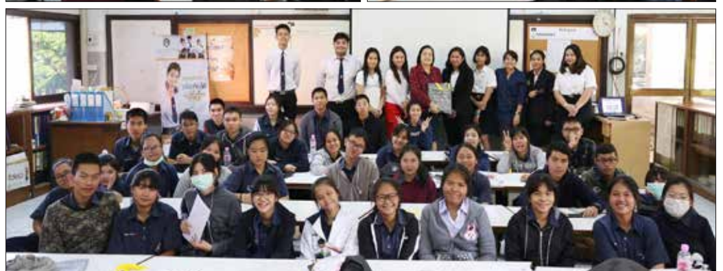
ณ โรงเรียนราชวินิต บางเขน เมื่อวันที่ ๒๐ และ ๒๑ ธันวาคม ที่พวนมา