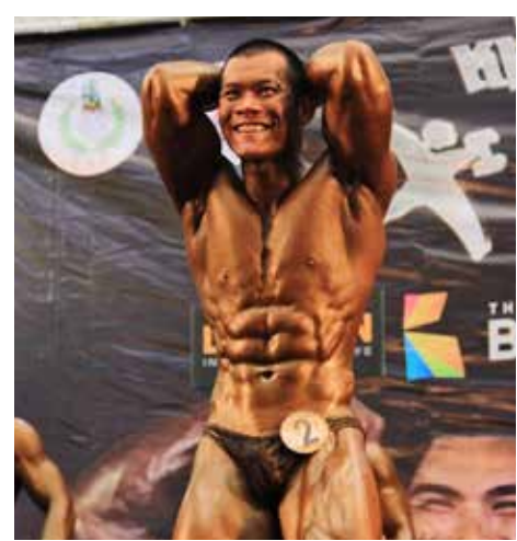
“ตุลย์” หนุมกลับมาใหญ่กว่าเหรียญเงิน หนุมกายงาม สวากกลับมาสวยปี ๒๐๑๘

สำนักวิทยบริการฯ จัดโครงการ “ARIT FAIR 2019” ENERGY AND ENVIRONMENT SAVING การอนุรักษ์พลังงานและสิ่งแวดล้อม เพื่อเป็นการเริ่มต้นโครงการห้องสมุดสีเขียวอย่างเป็นทางการ จากกิจกรรมดังกล่าว และยังเป็นหน่วยงานตัวอย่างด้านการอนุรักษ์พลังงานและสิ่งแวดล้อม และเป็นแบบอย่าง สร้างกระแสด้านการอนุรักษ์พลังงานในมหาวิทยาลัย