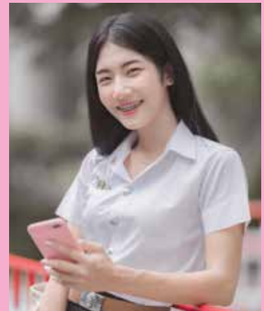
นักศึกษาระดับบัณฑิตศึกษา วิทยาลัยการแพทย์แผนจีน วิทยาลัยการแพทย์ทางเลือก นักศึกษารุ่นปีที่ ๕ สาขาวิชาการแพทย์แผนจีน วิทยาลัยการแพทย์ทางเลือก

ส่วนตัวที่ชอบทำกิจกรรมไม่ว่าจะในสาขา คณะ หรือมหาวิทยาลัย ที่จะร่วมกิจกรรมให้ได้มากที่สุด เพราะการทำกิจกรรมเราจะได้ประสบการณ์การทำงานกับคนหมู่มาก ได้รู้จักกับเพื่อน ๆ แต่เราก็ต้องไม่ทิ้งการเรียนนะคะ กิจกรรมไม่ได้พาให้เราแย่งถ้าเราแบ่งเวลาได้ถูกต้อง