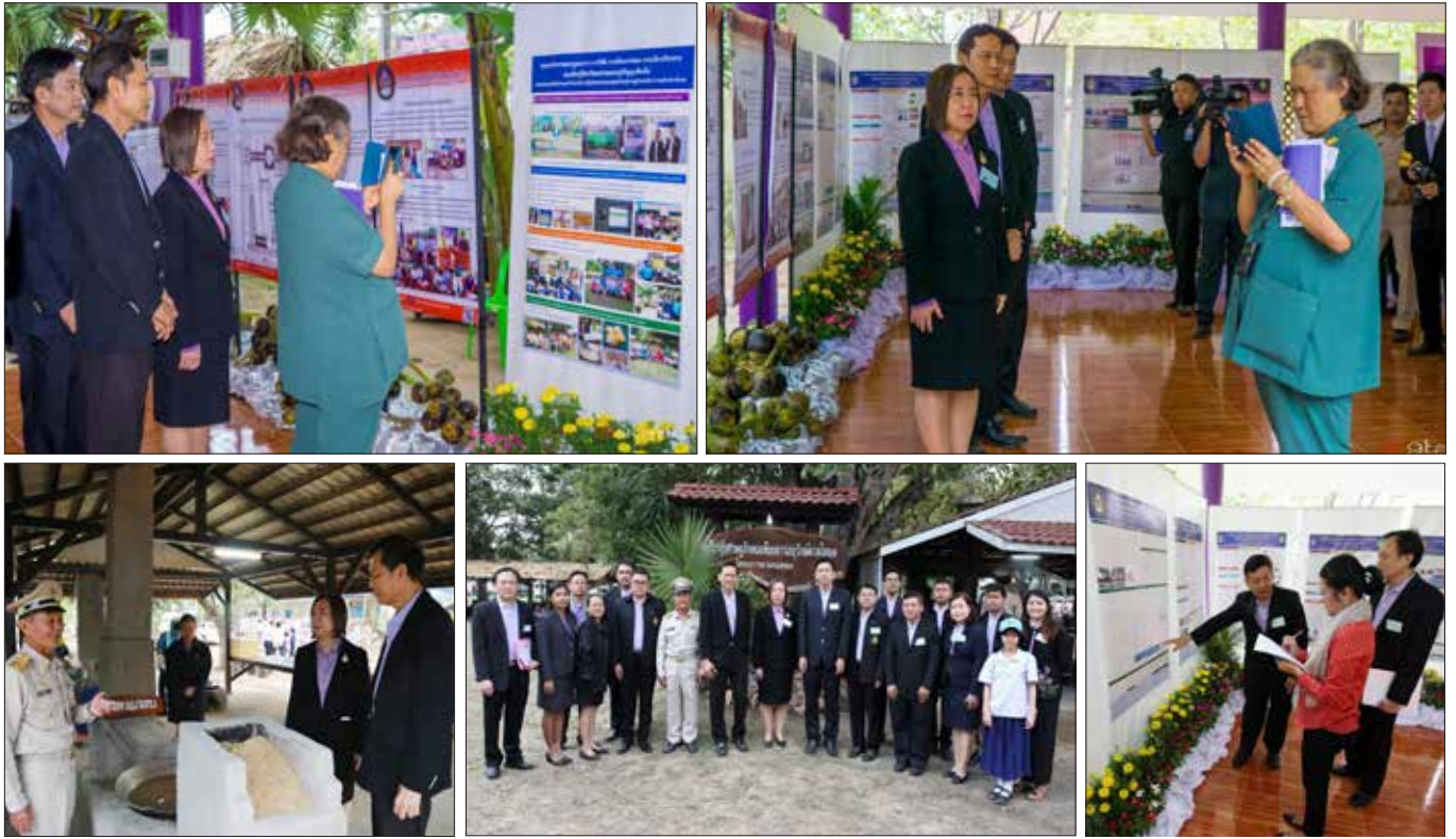
ณ ศูนย์เรียนรู้เศรษฐกิจพอเพียงการอนุรักษ์ตาลโตนด ต.ห้วยกรด อ.สรรคบุรี จ.ชัยนาท เมื่อวันที่ ๑๑ มกราคม ที่ผ่านมา