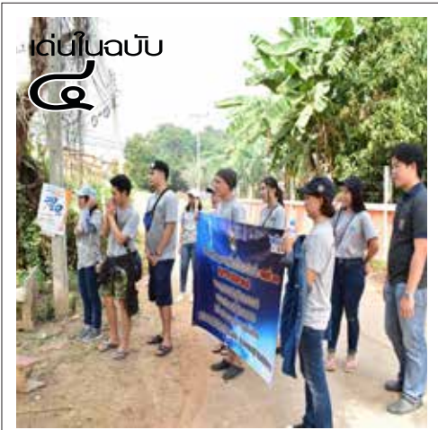
คลีนิกกฎหมายเคลื่อนที่ “หัวใจ”...พดุง “ความยุติธรรม” พร้อมพัฒนาชุมชนท้องถิ่น

“การประกวดครั้งนี้ สิ่งที่นักศึกษาจะได้รับกลับมาเลยคือความภาคภูมิใจอย่างแน่นอนแล้วก็สิ่งที่ตามมาคือความมั่นใจในตนเอง เพราะเราต้องยอมรับว่านักศึกษาของเราส่วนใหญ่มีความอ่อนน้อมถ่อมตนแล้วก็ไม่ค่อยเชื่อมั่นในตัวเองเท่าไรแต่การออกไปประกวดผลักดันให้เขาได้แสดงผลงานต่อหน้าคนภายนอกแล้วการเข้าร่วมหรือการได้รับรางวัลกลับมา ก็จะช่วยให้มีความภาคภูมิใจต่อสถาบันต่อตัวนักศึกษาเองรวมไปถึงความมั่นใจในการทำงาน คิดงาน และตัดสินใจในการทำงาน” อาจารย์พรเพ็ญ กล่าว