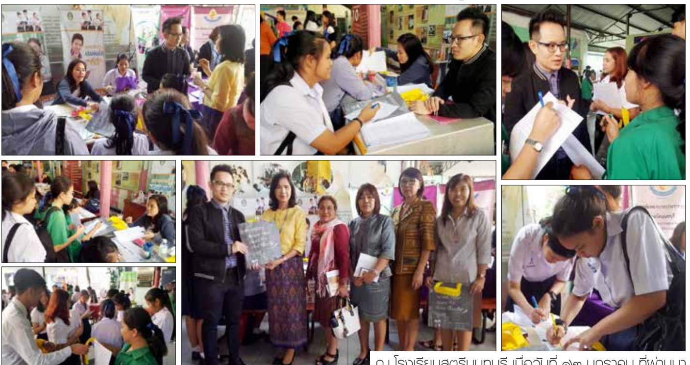
ณ โรงเรียนสตรีนนทบุรี เมื่อวันที่ ๑๒ มกราคม ที่ผ่านมา