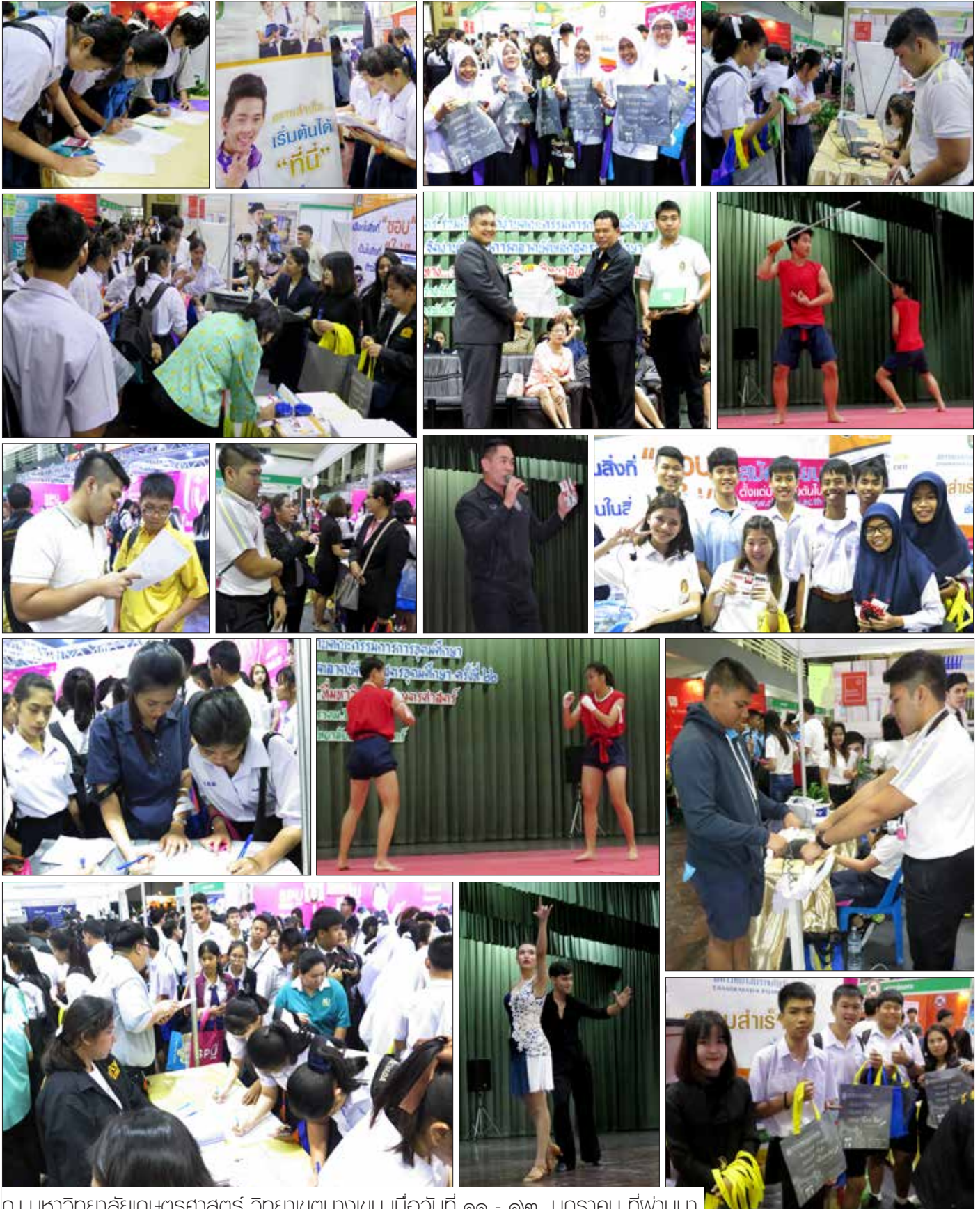
ณ มหาวิทยาลัยเกษตรศาสตร์ วิทยาเขตบางเขน เมื่อวันที่ ๑๑ - ๑๓ มกราคม ที่ฟานมา