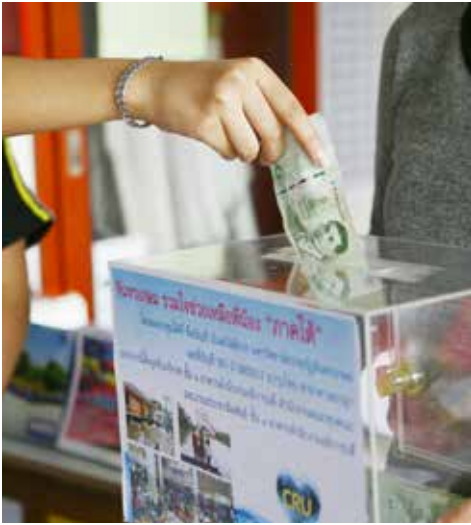
ร่วมด้วยช่วยกัน : นักศึกษา บุคลากร และประชาชนทั่วไป แบ่งปันน้ำใจ สมทบทุนช่วยเหลือผู้ประสบภัย “พายุปาบึก” ผ่านช่องทางกล่องรับบริจาคตามจุดต่าง ๆ โดยรอบมหาวิทยาลัย