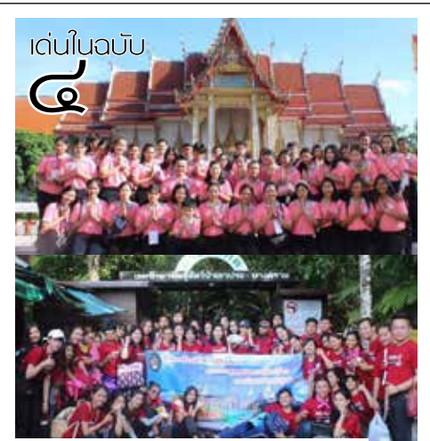
เตรียมความพร้อมฝึกปฏิบัติก้าวสู่การเป็น “บักกุ๊กกั๊ก”

สำนักศิลปะและวัฒนธรรม จัดโครงการเยาวชนรุ่นใหม่ ใส่ใจคุณธรรม โครงการนี้จัดขึ้นเพื่อเป็นการสนับสนุนในการเสริมสร้างให้ความรู้ในด้านคุณธรรม จริยธรรม และยังปลูกฝังค่านิยมความเป็นไทยให้แก่เยาวชน รวมไปถึงการสร้างเยาวชนต้นแบบของความเป็นพลเมืองดี มีระเบียบวินัย ตามพระราชบัญญัติการศึกษาอีกด้วย