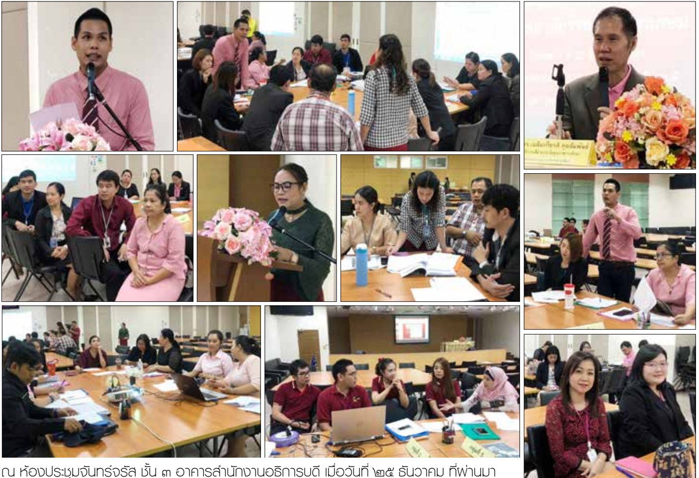
ณ ห้องประชุมจันทร์จรัส ชั้น ๓ อาคารสำนักงานอธิการบดี เมื่อวันที่ ๒๕ ธันวาคม ที่ผ่านมา

You can't make someone else's choices so you shouldn't let someone else make yours. Follow your heart.