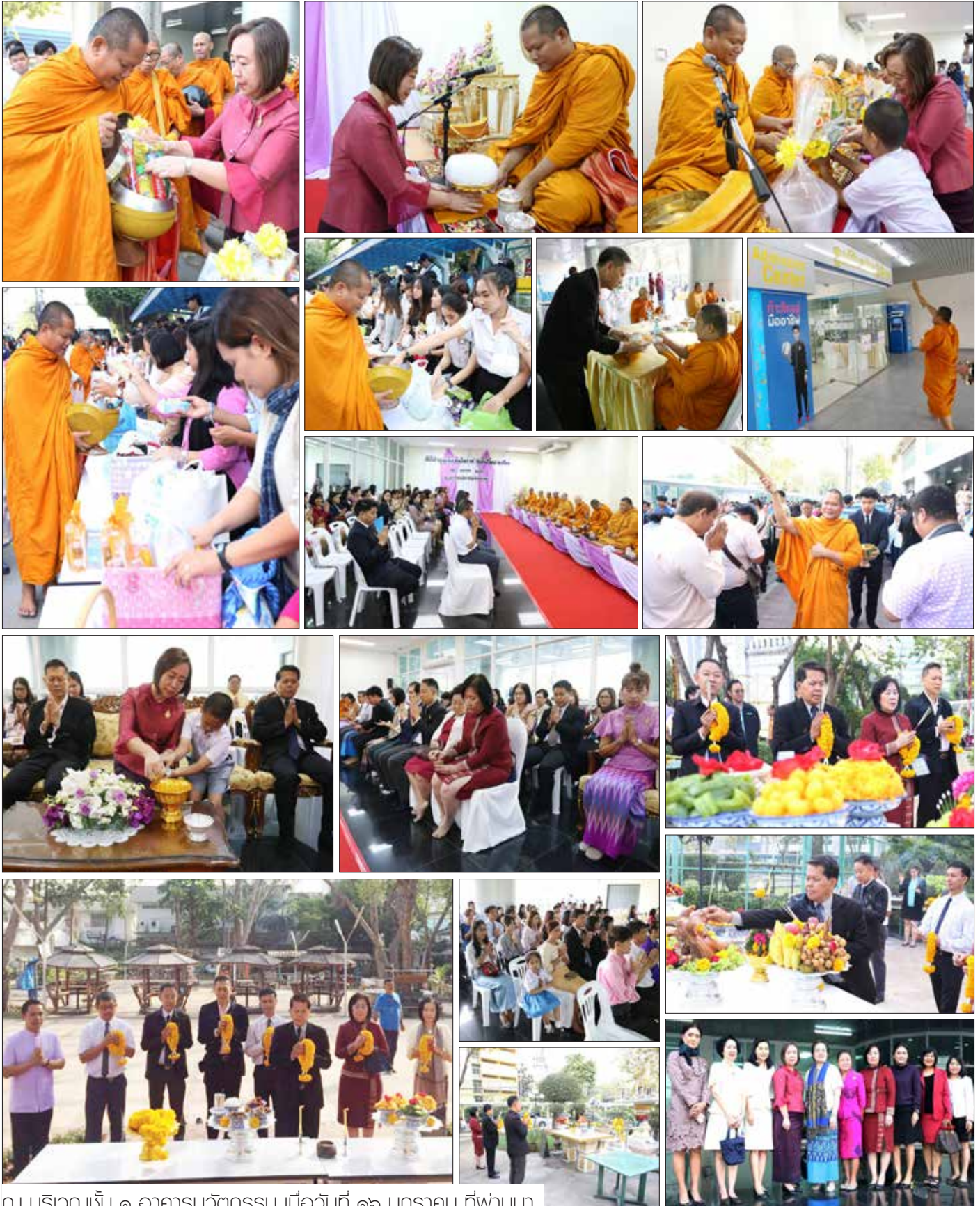
ณ บริเวณชั้น ๑ อาคารนวัตกรรม เมื่อวันที่ ๑๖ มกราคม ที่ผ่านมา