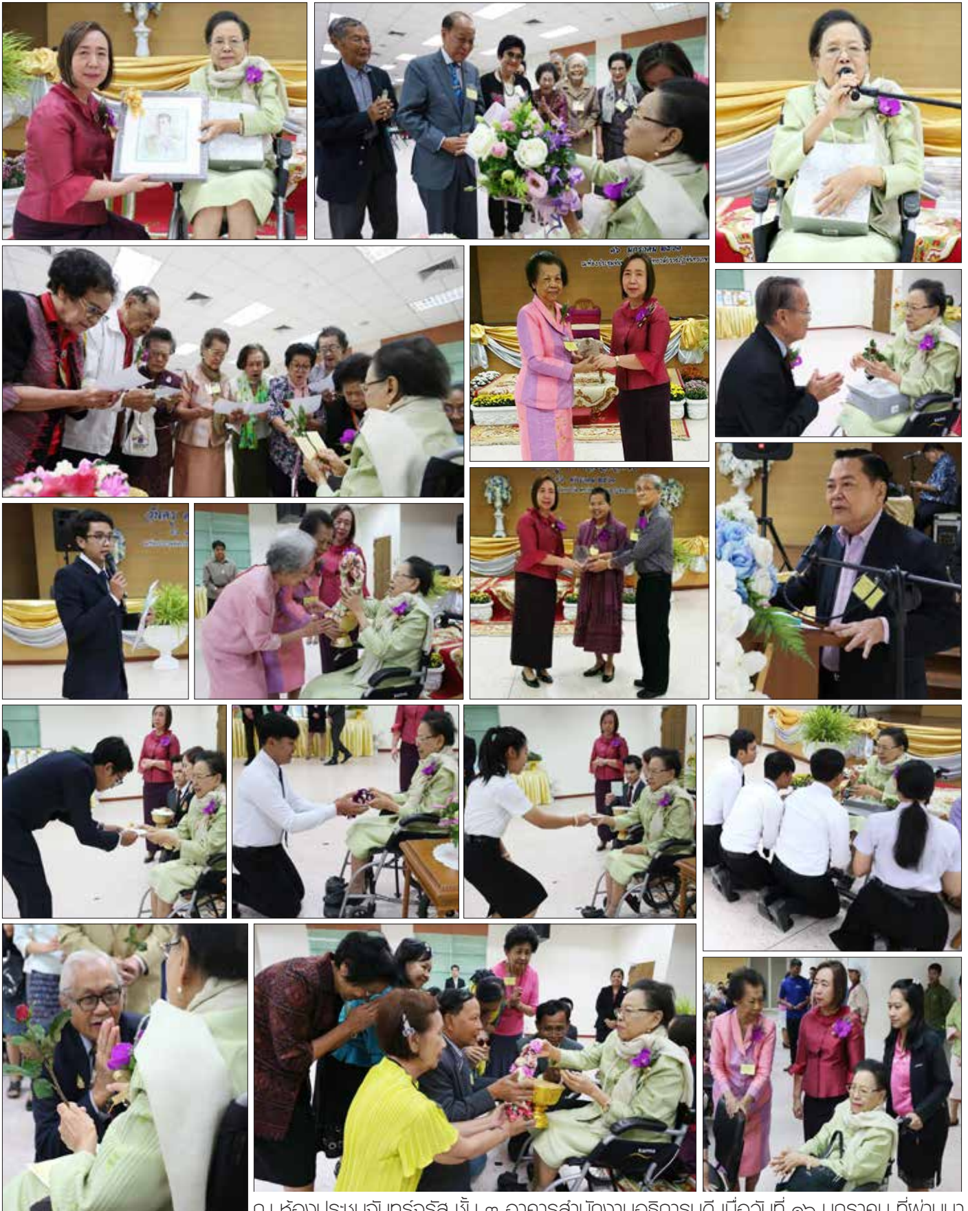
ณ ห้องประชุมจันทร์จรัส ชั้น ๓ อาคารสำนักงานอธิการบดี เมื่อวันที่ ๑๖ มกราคม ที่ผ่านมา