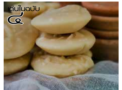
เดินในอับ

ด้านการวิจัย ให้แก่ชาวบ้านทั้งก่อนการจัดงาน มหกรรมฯ และหลังงานมหกรรมฯ นี้ เพื่อให้ ผลิตภัณฑ์ที่ได้รับการพัฒนาจากปลาร้า ไม่ว่าจะ เป็นปลาร้าผง ปลาร้าก้อน น้ำพริกปลาร้า และ อื่น ๆ อีกมากมาย โดยคณาจารย์จากสาขาวิชา วิทยาศาสตร์และเทคโนโลยีการอาหาร ซึ่งพัฒนาศักยภาพให้กับผู้ประกอบการด้านอาหารให้มีรายได้ที่นอกเหนือจากสินค้าที่ผู้ประกอบการเคยจัด จำหน่ายไว้” ดร.อำนาจ กล่าว