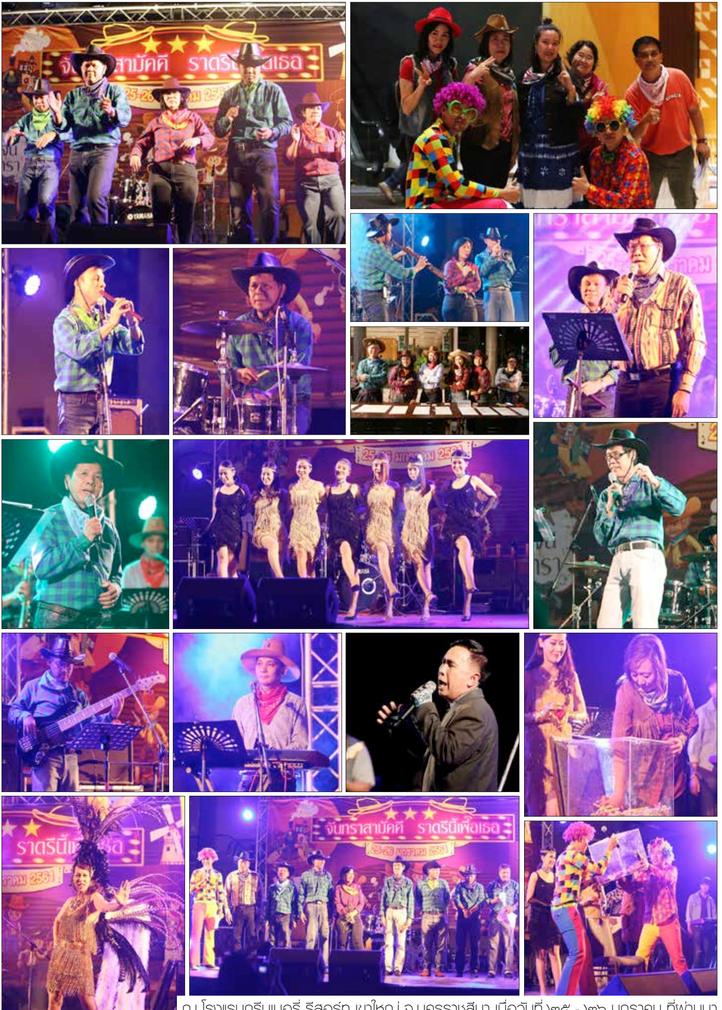
ณ โรงแรมกรีนเนอร์ รีสอร์ท เขาใหญ่ จ.นครราชสีมา เมื่อวันที่ ๒๕ - ๒๖ มกราคม ที่ผ่านมา