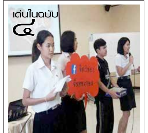
“จิตวิทยา”... ห่วงใย ใส่ใจการใช้ชีวิต เปิดห้องปรึกษาเชิงจิตวิทยารองรับ

ผู้อำนวยการฯ กล่าวต่ออีกว่า ในอนาคตอาจ จะมีการขยายการอบรมมากกว่า ๔ ภาษา อาทิ ภาษาเวียดนาม และอื่น ๆ รวมไปถึงการจัดทำ สื่อการเรียนการสอนภาษาญี่ปุ่นเพื่อใช้ในชีวิต ประจำวัน ซึ่งเป็นความร่วมมือระหว่างศูนย์ ภาษาฯ และสาขาวิชาภาษาญี่ปุ่น ที่ต้องการ สนับสนุนและพัฒนาด้านภาษาให้มีศักยภาพยิ่งขึ้น