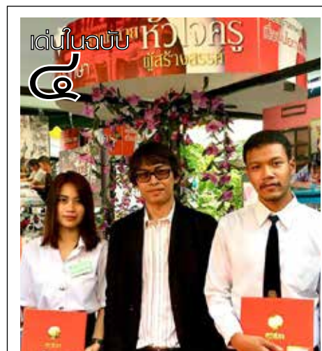
๒ คู่บ่าวสาวศิลปกรรม สร้างชื่อคว้ารางวัลประกวดถ่ายภาพคุรุสภา

“สำหรับโครงการที่จัดขึ้นนี้ ถือได้ว่าเป็นเรื่องที่น่ายินดีที่มีเยาวชนได้รับรู้ และภาคภูมิใจในศิลปวัฒนธรรมไทย เยาวชนเหล่านี้จะเป็นผู้อนุรักษ์ มีความภาคภูมิใจในความเป็นไทย และภูมิใจที่ได้เกิดเป็นคนไทย มีบรรพบุรุษที่สร้างสิ่งดี ๆ ไว้ให้ลูกหลานไทยได้สานต่อ สืบทอด อนุรักษ์