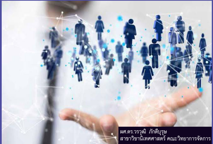
พศ.ดร.วรวิมล ภักดีบุรุษ สาขาวิชาเทคโนโลยีสารสนเทศ คณะวิทยาการจัดการ

ซอฟต์ สกิลส์ (soft skills) คือ หนึ่งในทักษะแห่งอนาคต เป็นทักษะที่ค่อนข้างเป็นนามธรรมและไม่ใช้ทักษะเชิงอาชีพโดยตรง แต่เป็นทักษะทางอ้อมที่มีช่วยส่งเสริมให้การทำงานในวิชาชีพนั้นราบรื่นขึ้น สะดวกมากยิ่งขึ้น และนำไปสู่ความสำเร็จได้อย่างมีประสิทธิภาพ เช่น ทักษะ