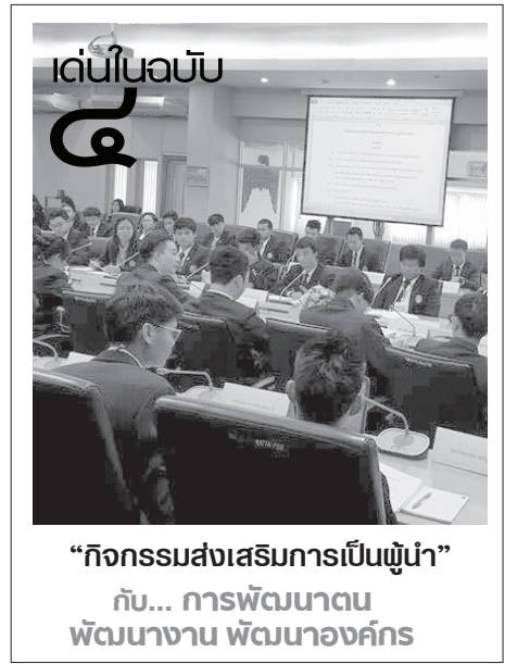
เด่นในฉบับ ๕ “กิจกรรมส่งเสริมการเป็นผู้นำ” กับ... การพัฒนาคน พัฒนางาน พัฒนาองค์กร

ปีจะมีศิลปินมาร่วมงานมากมาย โดยเน้นให้นักศึกษาทำงานกันเองบริหารงานเองในทุกขั้นตอนของงาน “การจัดกิจกรรมครั้งนี้เป็นโอกาสที่ดีที่จะได้รับประสบการณ์ใหม่ ๆ ถึงการจัดงาน อ่านต่อหน้า ๖