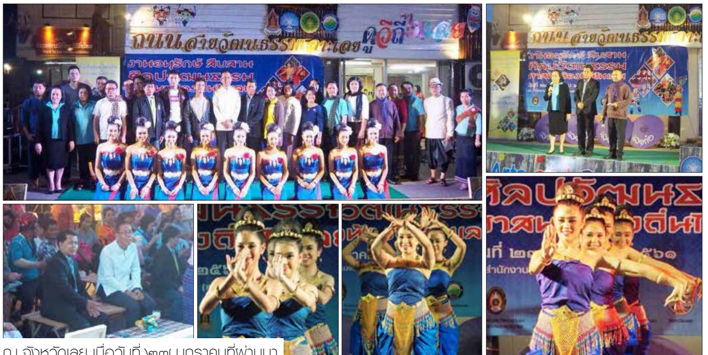
ณ จังหวัดเลย เมื่อวันที่ ๒๗ มกราคมที่ผ่านมา