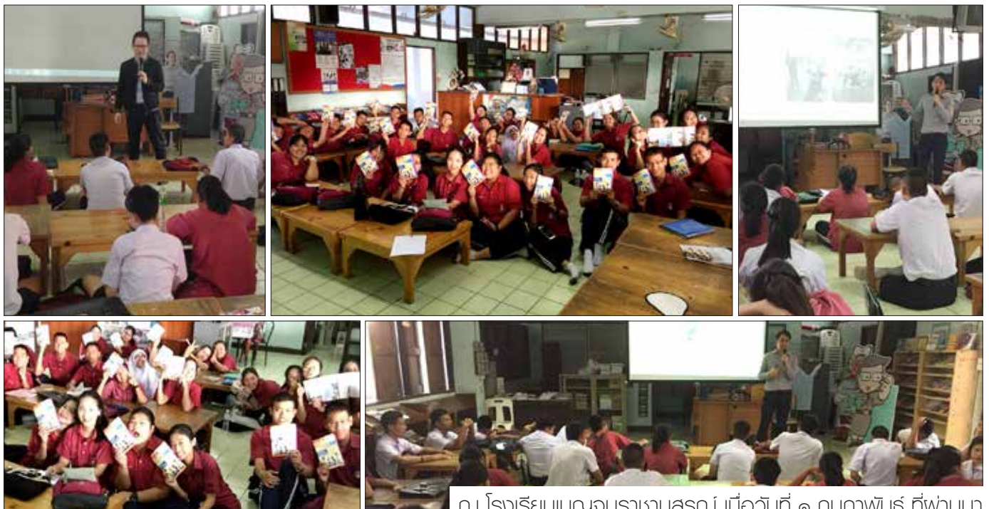
ณ โรงเรียนเบญจมราชานุสรณ์ เมื่อวันที่ ๑ กุมภาพันธ์ ที่ผ่านมา