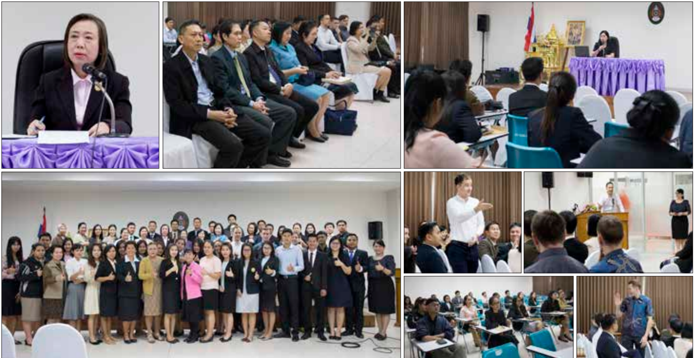
ณ ห้องประชุมกองพัฒนานักศึกษา ชั้น ๕ อาคารกิจการนักศึกษา (๓๓) เมื่อวันที่ ๑๕ มกราคม - ๒ กุมภาพันธ์ ที่ผ่านมา