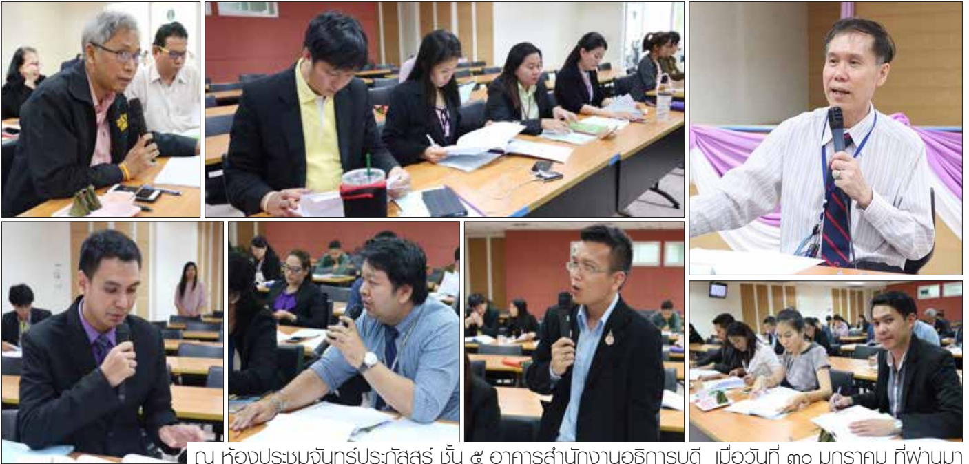
ณ ห้องประชุมจันทร์ประภัสสร ชั้น ๕ อาคารสำนักงานอธิการบดี เมื่อวันที่ ๓๐ มกราคม ที่ผ่านม