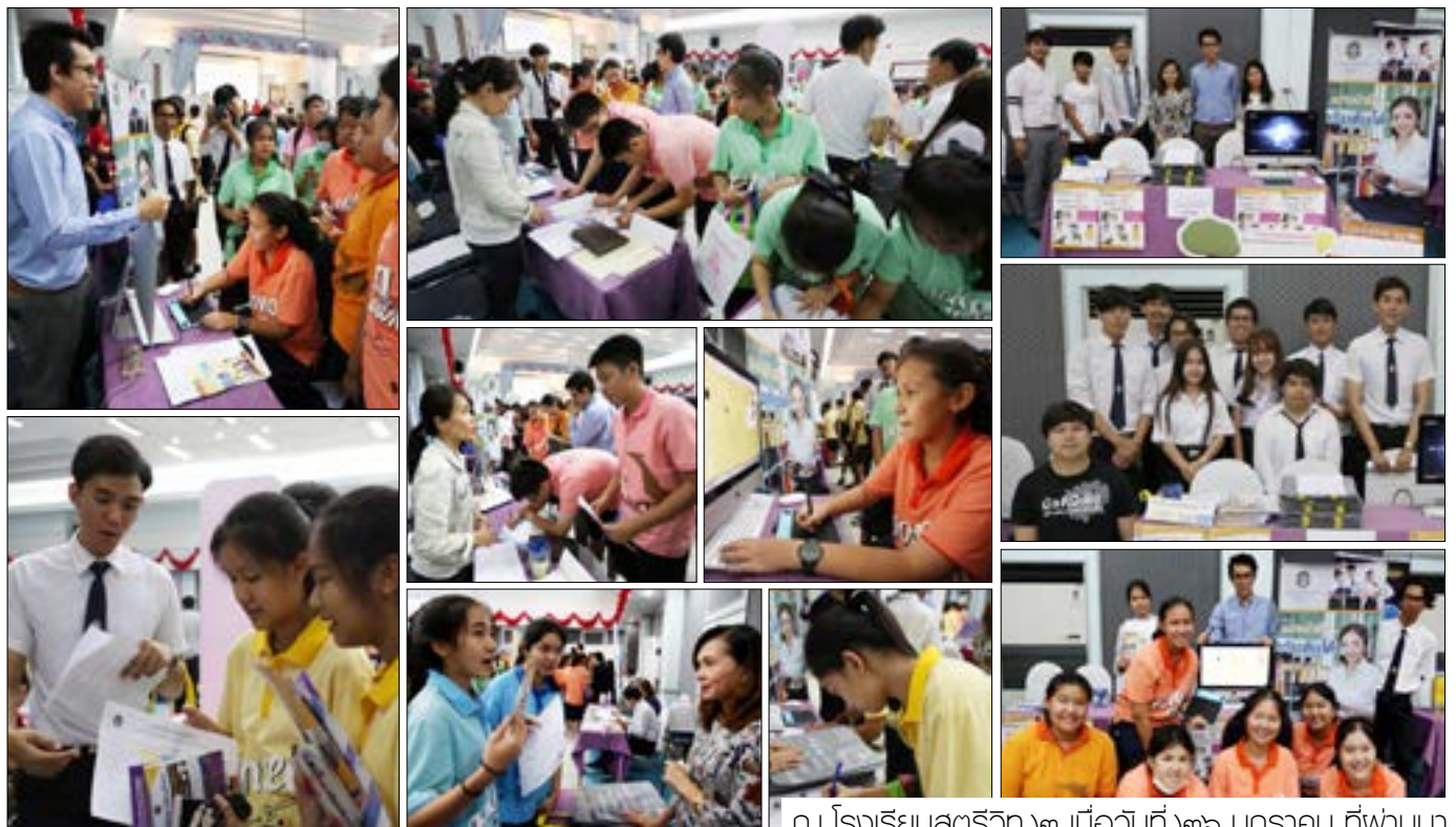
ณ โรงเรียนสตรีวิทยา ๒ เมื่อวันที่ ๑๖ มกราคม ที่ผ่านมา