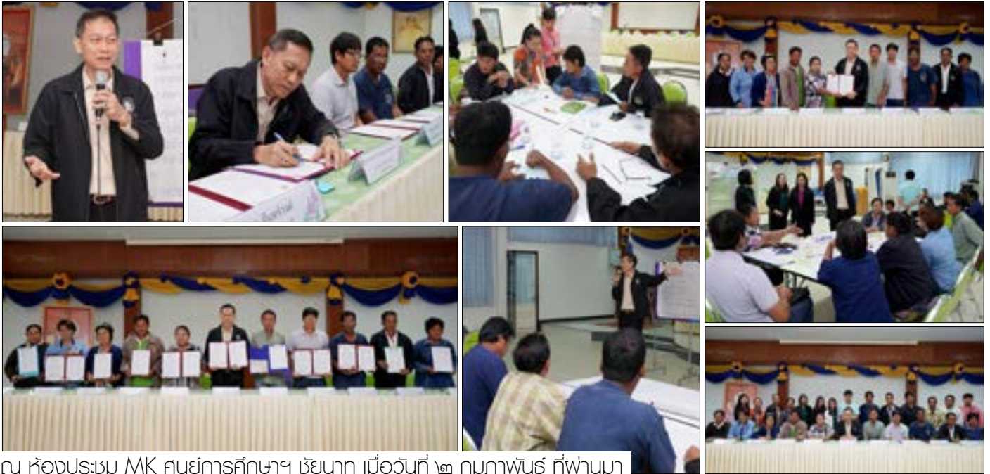
ณ ห้องประชุม MK ศูนย์การศึกษา ชัยนาท เมื่อวันที่ ๑๒ กุมภาพันธ์ ที่ผ่านมา