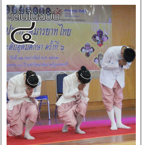
๔ นศ. สร้างชื่อคว้ารางวัลระดับอุดมศึกษา กับเวทีการประกวดมารยาทไทย ครั้งที่ ๖

ประธานชมรมฯ กล่าวต่อว่า ผู้เข้าร่วม กิจกรรมนอกจากจะได้รับความสุขทางจิตใจแล้ว ยังถือได้ว่าเป็นโอกาสที่จะมาร่วมกันทำบุญด้วยการ ถวายพระทีปเป็นพุทธบูชา มีการสวดมนต์ นั่งสมาธิ ให้จิตใจสงบในด้านการอ่านหนังสือสอบจิตใจจะได้ ไม่วอกแวกมีสมาธิกับการอ่านหนังสือมากขึ้นและ เป็นความสบายใจที่ได้ทำบุญนานๆครั้งไม่มาก ก็น้อยๆ และที่สำคัญงานจัดงานนี้ซึ่งก็เป็นนักศึกษา เช่นเดียวกันจะได้ฝึกฝนการทำงานจริง ๆ เพราะกว่า