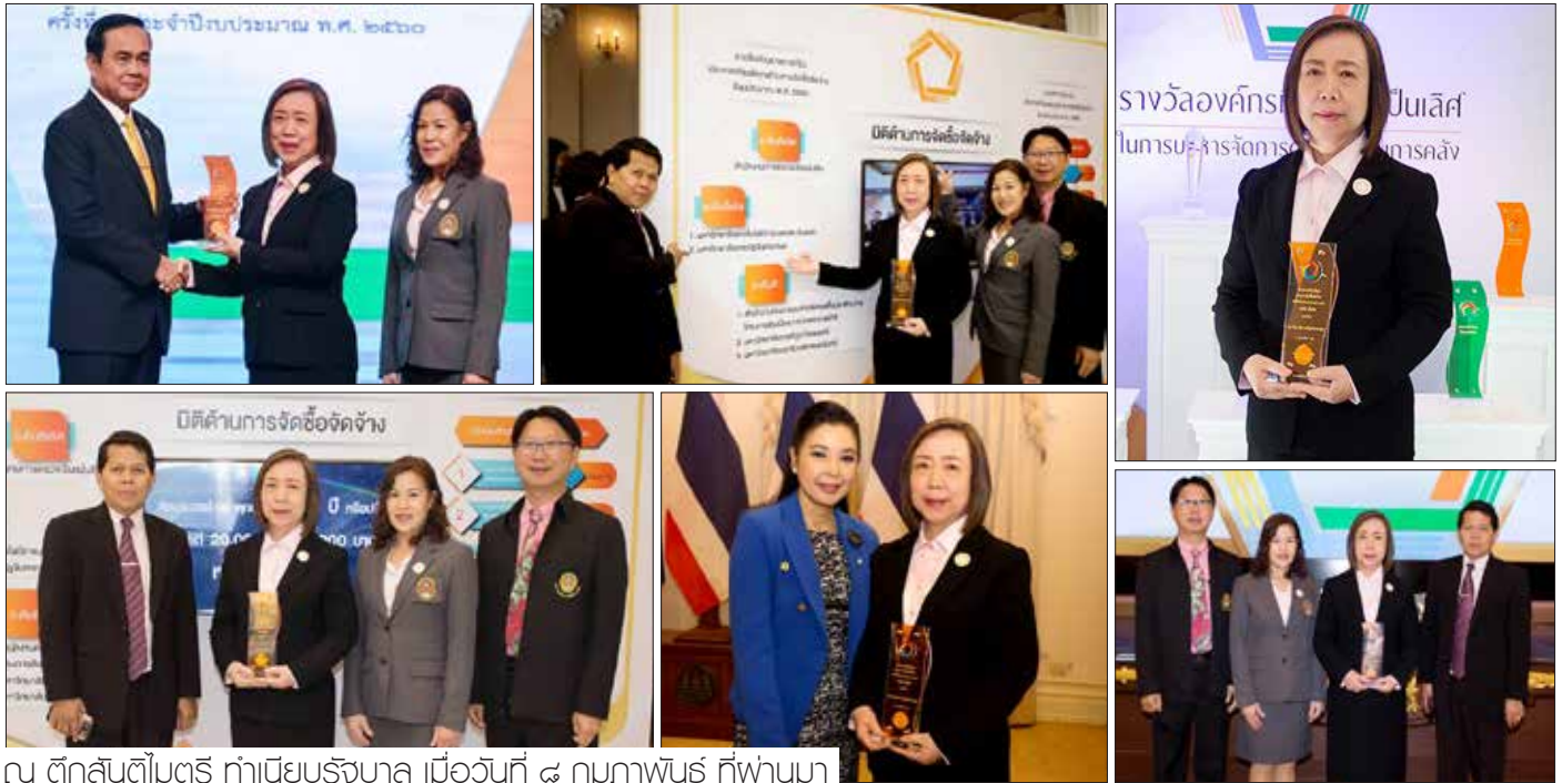
ณ ตึกสันติไมตรี ทำเนียบรัฐบาล เมื่อวันที่ ๘ กุมภาพันธ์ ที่ผ่านมา