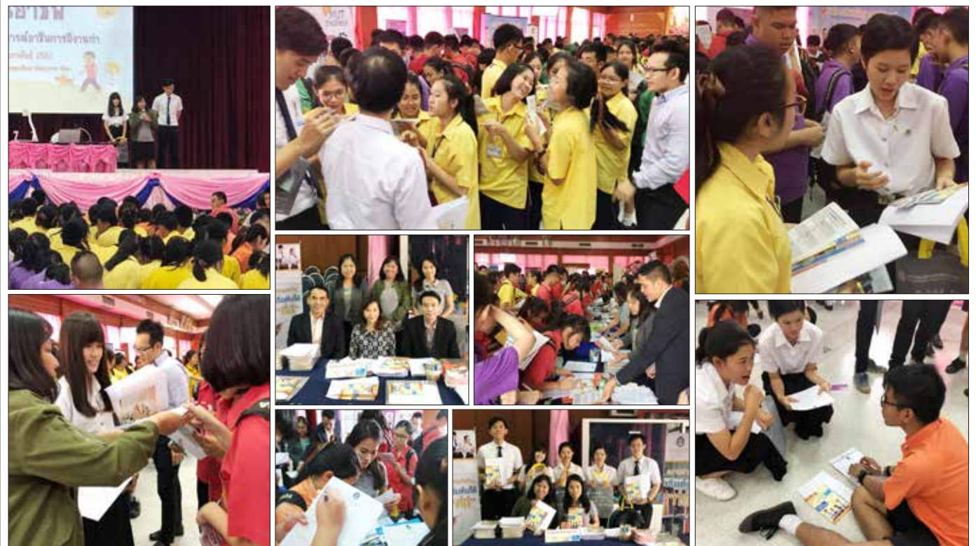
ณ โรงเรียนเตรียมอุดมศึกษาพัฒนาการ - รัชดา เมื่อวันที่ ๙ กุมภาพันธ์ ที่ผ่านมา