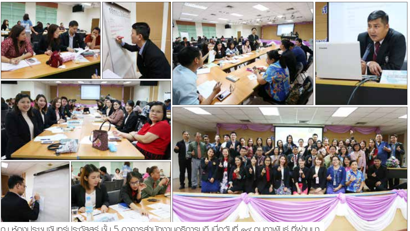
ณ ห้องประชุมจันทรจักรประภัสร์ ชั้น 5 อาคารสำนักงานอธิการบดี เมื่อวันที่ ๑๕ กุมภาพันธ์ ที่ผ่านมา