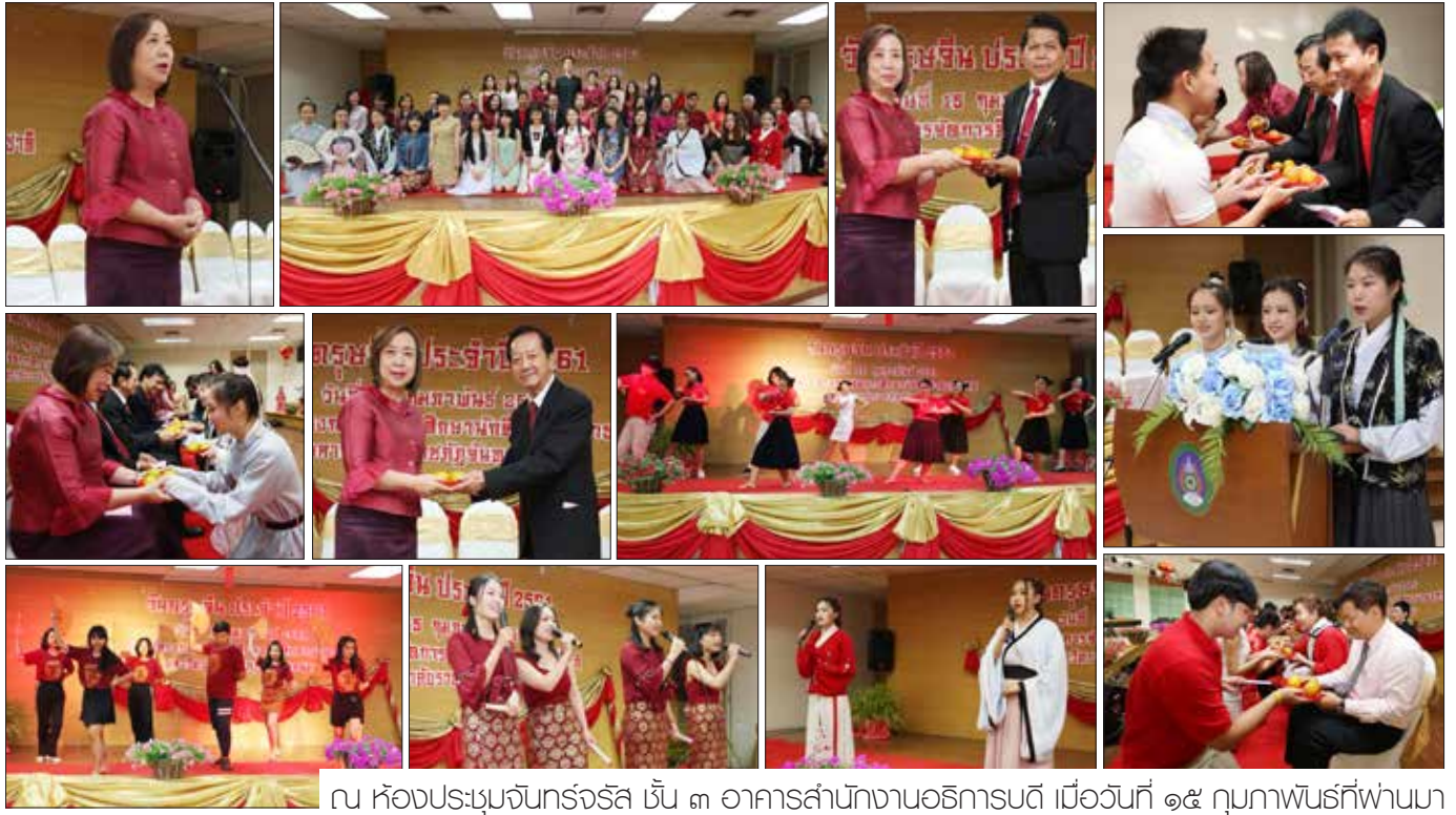
ณ ห้องประชุมจันทรจักรรัส ชั้น ๓ อาคารสำนักงานอธิการบดี เมื่อวันที่ ๑๕ กุมภาพันธ์ที่ผ่านมา