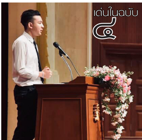
เด่นในฉบับ

“อยากเชิญชวนทุกคนให้มาร่วมกับคอนเสิร์ตในครั้งนี้ นอกจากความสนุกสนานจากเหล่าศิลปินแล้ว เรายังได้ร่วมกันทำบุญด้วยครับ สำหรับใครที่สนใจ สามารถสั่งซื้อบัตรได้ทางเพจ Rock on The Moon หรือติดต่อที่เบอร์ ๐๙ ๕๕๒๐ ๔๗๔๓ (คุณพลุ๊ค) ๐๙ ๕๕๖๖ ๙๔๗๔ (คุณเว็บบ)” ประธานการจัดงานฯ กล่าว