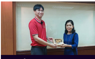
ศึกษาดูงาน