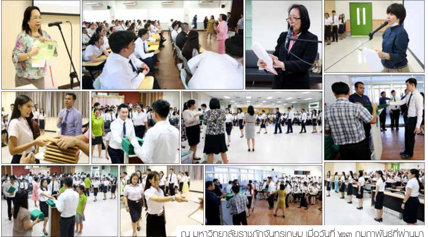
ณ มหาวิทยาลัยราชภัฏจันทรเกษม เมื่อวันที่ ๒๓ กุมภาพันธ์ที่ผ่านมา