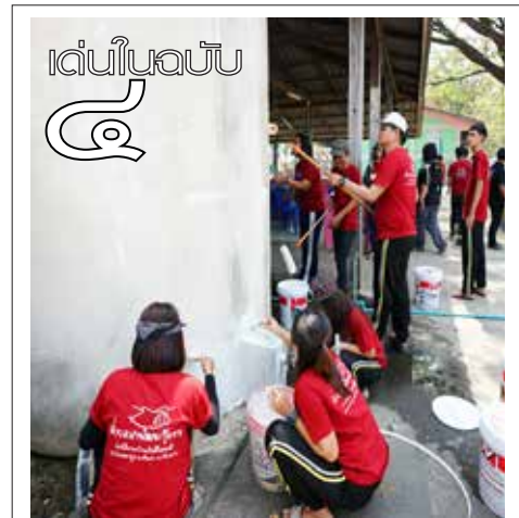
เด่นในฉบับ

ประธานคกก.ด้านศิลปะฯ กล่าวต่อว่า การบูรณาการนั้น แต่ละสาขาวิชาสามารถนำเสนอได้ออกมาอย่างดี อาทิ สาขาวิชาศิลปกรรม การกีฬา ที่เรียนรู้ด้านกีฬา ภายภาคต่าง ๆ นำการเล่นไทยมาผสมผสานในการนำเสนอ