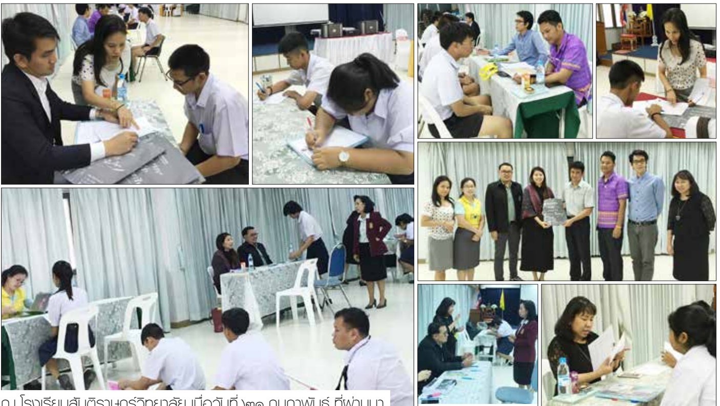
ณ โรงเรียนสันติราษฎร์วิทยาลัย เมื่อวันที่ ๒๑ กุมภาพันธ์ ที่ผ่านมา