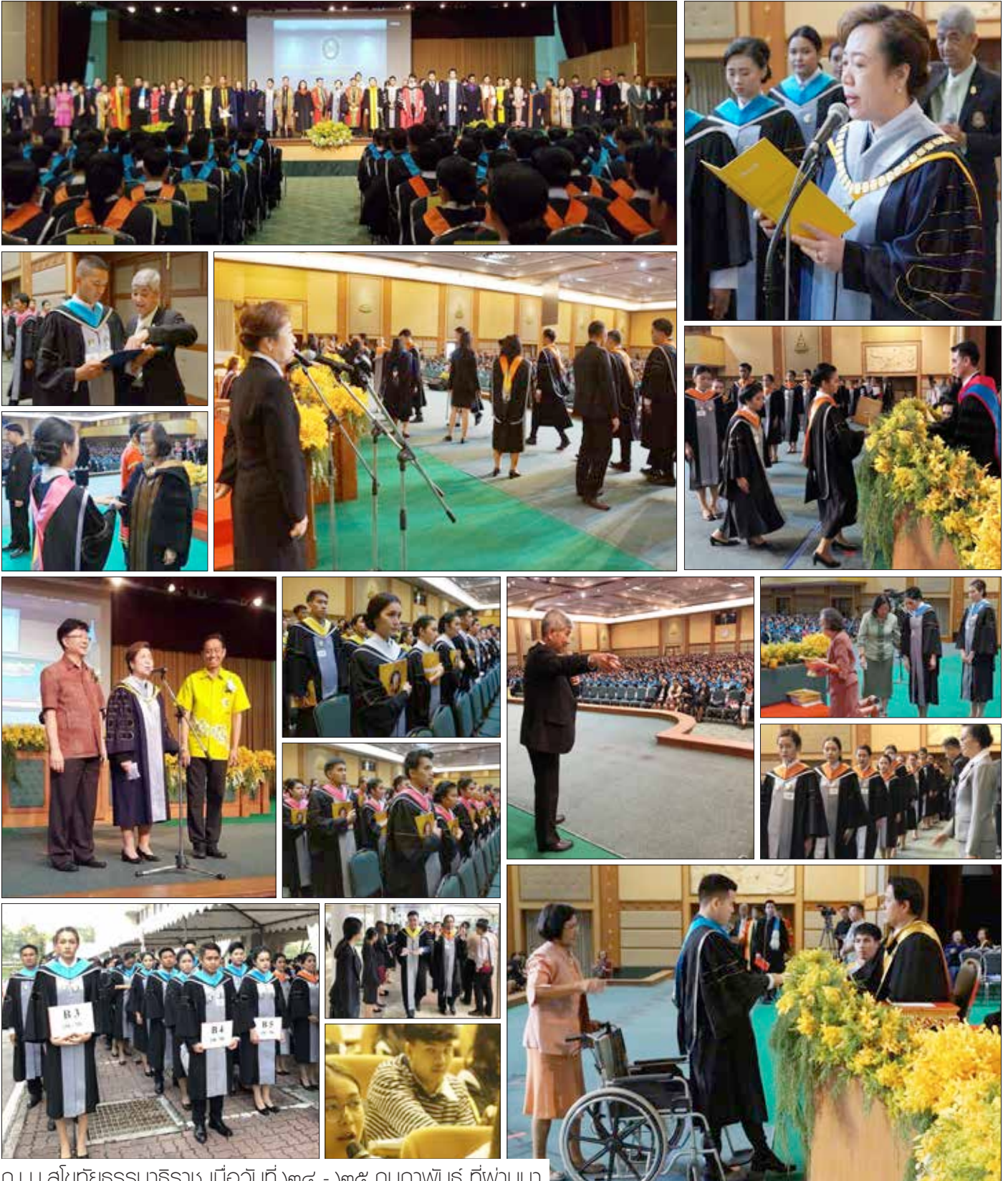
ณ ม.สุโขทัยธรรมาธิราช เมื่อวันที่ ๒๔ - ๒๕ กุมภาพันธ์ ที่ผ่านมา