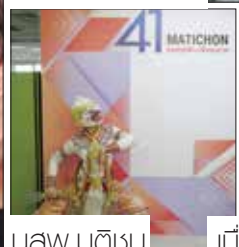
นางสาว.มติชน