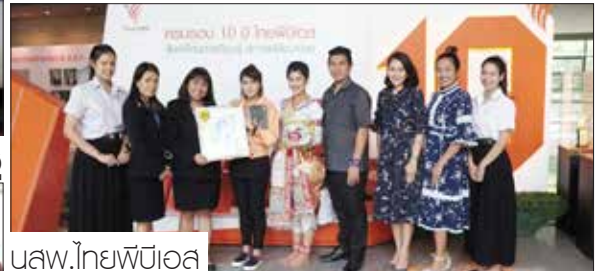
นางสาว.ไทยพีบีเอส