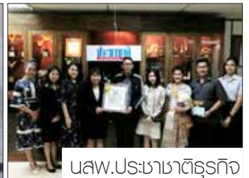
นางสาว.ประชาชาติธุรกิจ