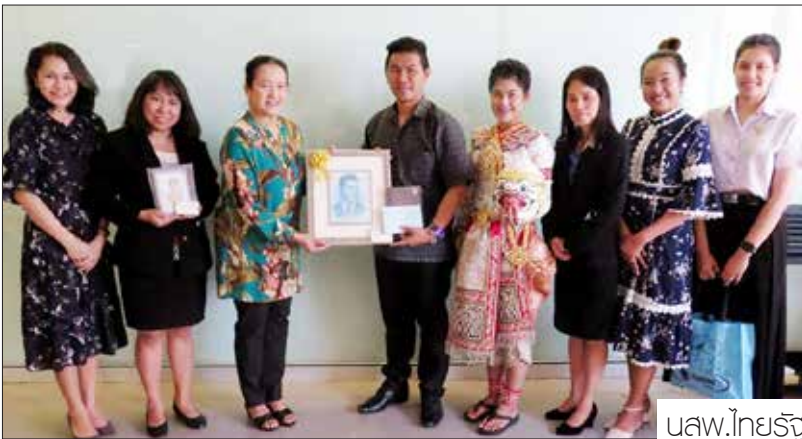
นางสาว.ไทยรัฐ