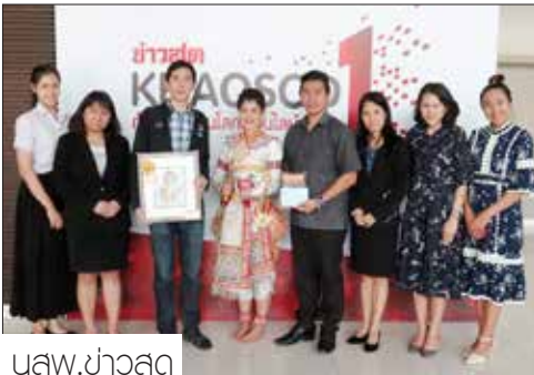
นางสาว.ข่าวสด