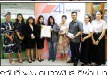
เมื่อวันที่ ๒๖ กุมภาพันธ์ ที่ผ่านมา