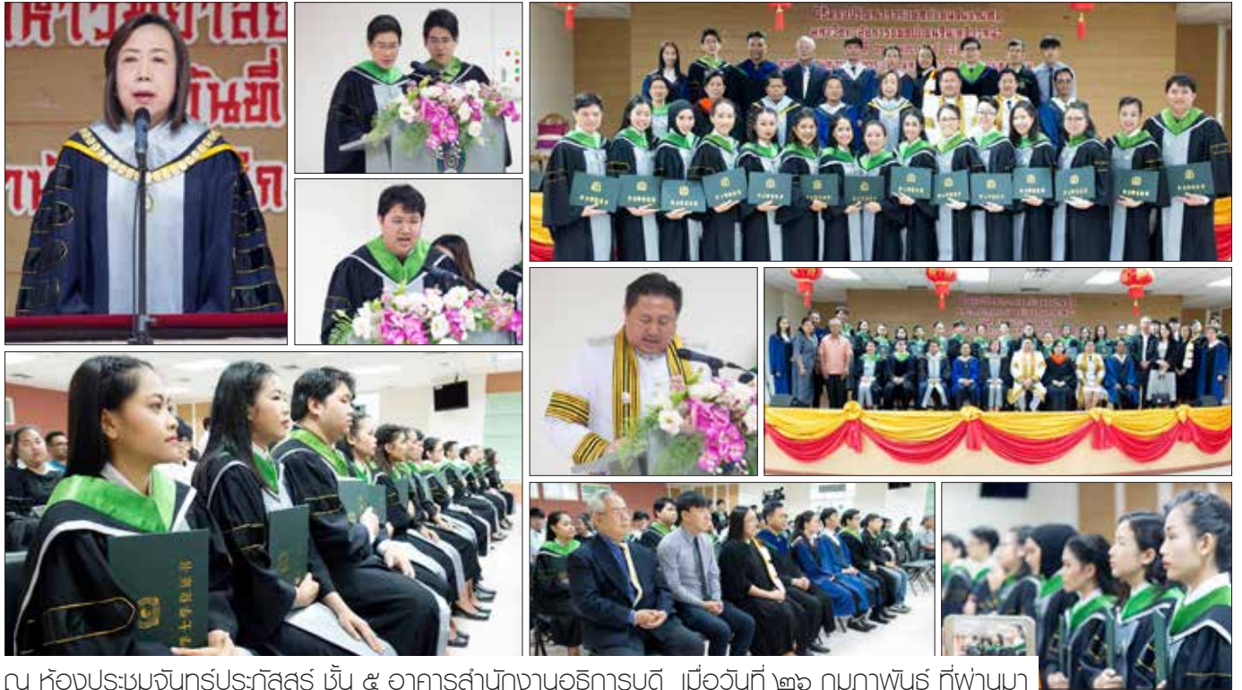
ณ ห้องประชุมจันทร์ประภัสสร ชั้น ๕ อาคารสำนักงานอธิการบดี เมื่อวันที่ ๒๖ กุมภาพันธ์ ที่ผ่านมา