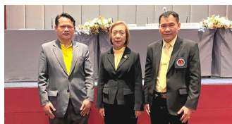
ลงนามความร่วมมือ