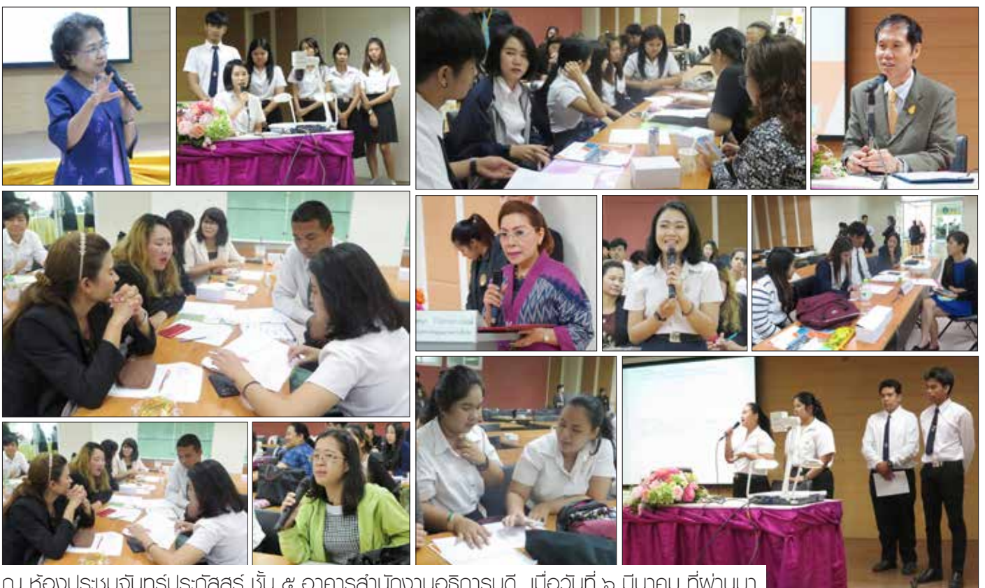
ณ ห้องประชุมจันทร์ประภัสร์ ชั้น ๕ อาคารสำนักงานอธิการบดี เมื่อวันที่ ๖ มีนาคม ที่ผ่านมา