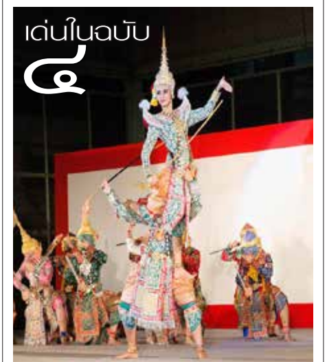
“๑๑ ปี โขนผู้หญิงจันทรเกษม” สืบสานวัฒนธรรม ส่งต่อสู่ชุมชน

“โรคพิษสุนัขบ้าเป็นโรคที่เป็นแล้วไม่มียารักษาให้หายขาดได้ในตอนนี้ แต่มีวิธีที่ป้องกันไม่ให้สัตว์ที่เลี้ยงไว้เป็นเชื้อโรคนี้ คือ การนำสัตว์เลี้ยงไปฉีดวัคซีนป้องกันโรคพิษสุนัขบ้าเป็นประจำทุกปี และควรเลี้ยงสัตว์ในบริเวณที่มีรั้วรอบขอบชิด และห้ามปล่อยออกไปคลุกคลีกับสุนัขจรจัดนอกบ้าน รวมทั้งห้ามเลี้ยงสุนัขจรจัดบริเวณหน้าบ้าน เพราะสุนัขจรจัดแต่ละตัวอาจจะเป็นตัวการในการแพร่เชื้อได้ เพียงแค่นี้ก็สามารถป้องกันและห่างไกลจากโรคพิษสุนัขบ้าได้”