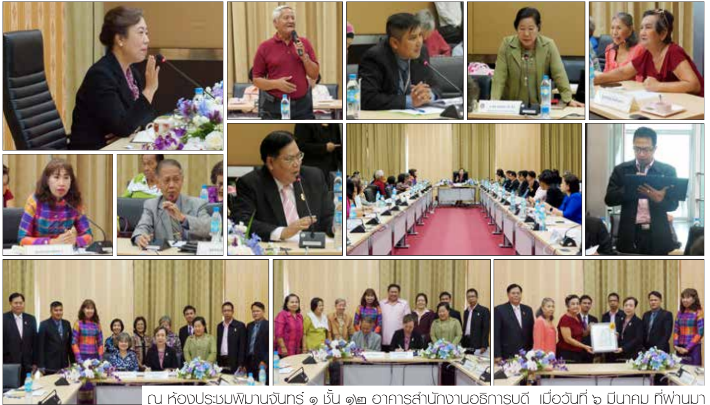
ณ ห้องประชุมพินานจันทร์ ๑ ชั้น ๑๒ อาคารสำนักงานอธิการบดี เมื่อวันที่ ๖ มีนาคม ที่ผ่านมา