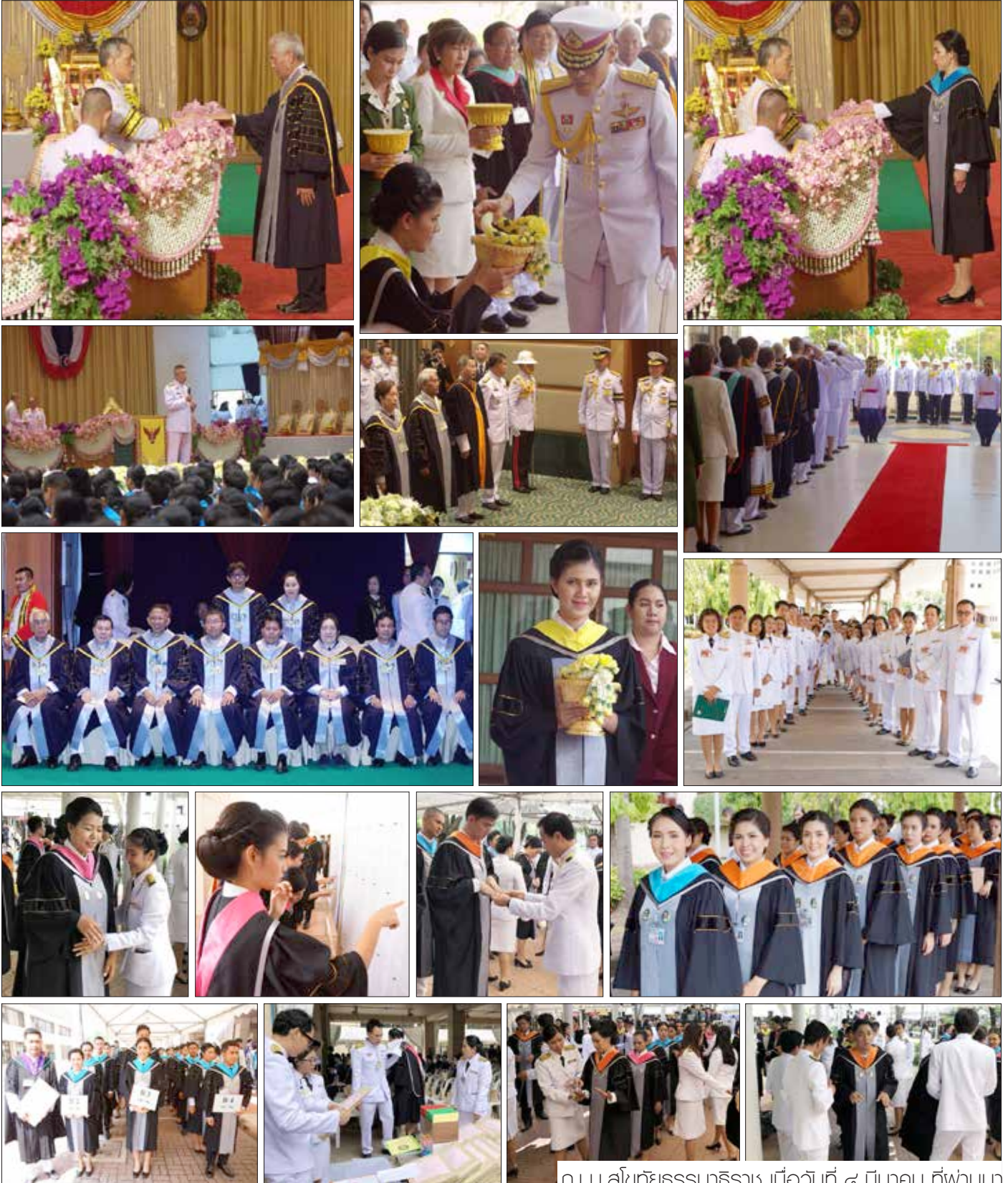
ณ ม.สุโขทัยธรรมาธิราช เมื่อวันที่ ๕ มีนาคม ที่ฟานมา