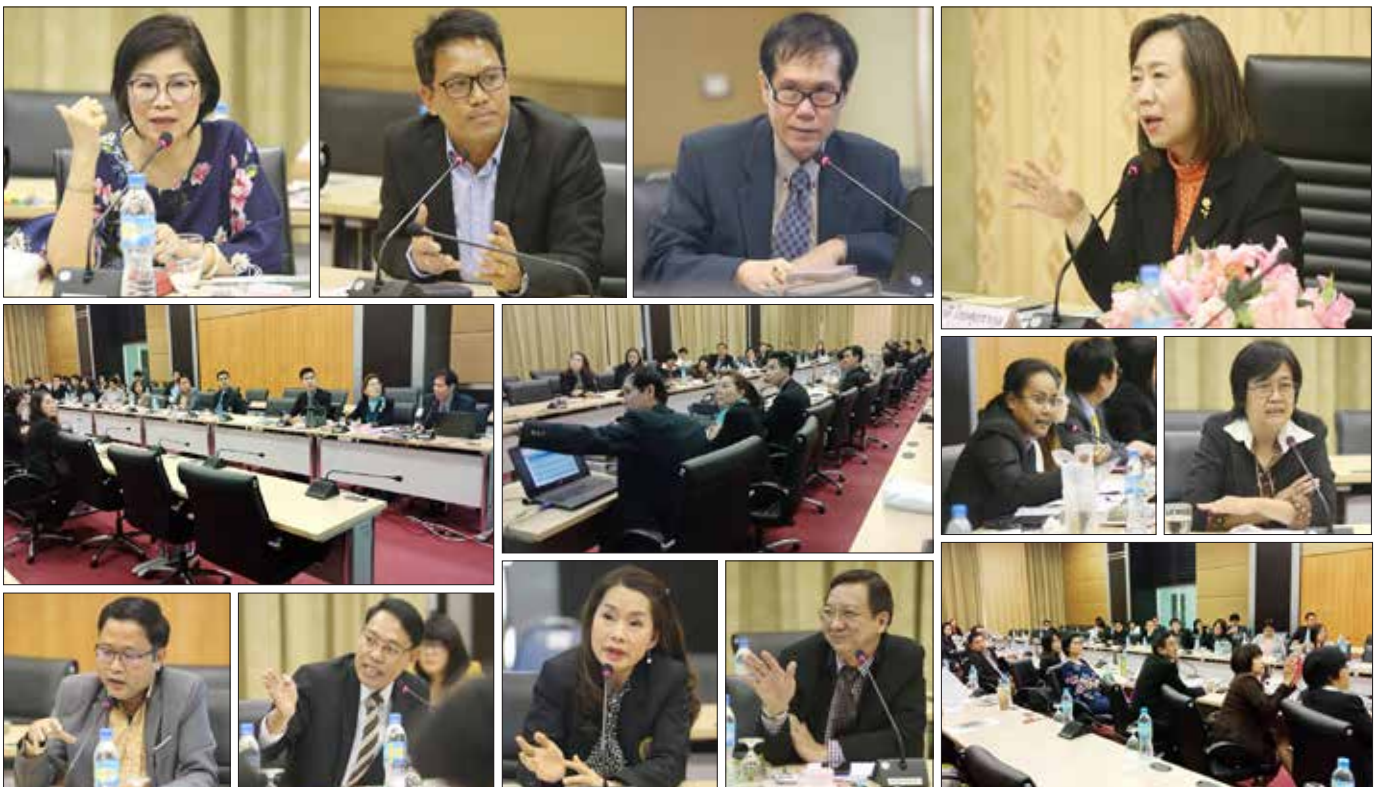
ณ ห้องประชุมพิฆานจันทร์ ๑ ชั้น ๑๒ อาคารสำนักงานอธิการบดี เมื่อวันที่ ๑๒ มีนาคม ที่ผ่านมา