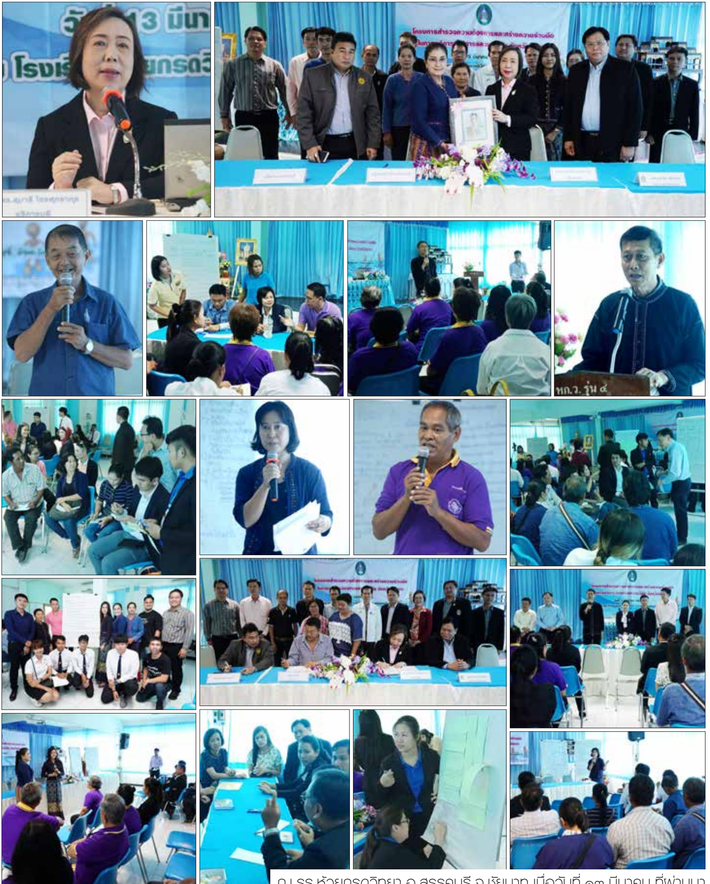
ณ รร.ห้วยกรดวิทยา อ.สรรคบุรี จ.ชัยนาท เมื่อวันที่ ๑๓ มีนาคม ที่ผ่านมา