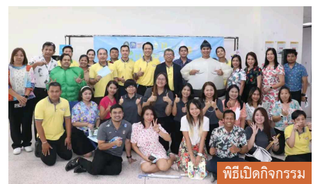
พิธีเปิดกิจกรรม

“ในปีที่ผ่านมา กระแสตอบรับดีมาก มีบุคลากรจำนวนมากที่ได้รับรางวัล ประสบความสำเร็จในการดูแลสุขภาพของตนเอง และเรียกร้องให้จัดกิจกรรมอย่างต่อเนื่อง ซึ่งทางสภาคณาจารย์ฯ ได้เปิดกิจกรรมและลงทะเบียนผู้เข้าร่วมกิจกรรมไปเมื่อเร็ว ๆ นี้ ครั้งนี้ เราหวังว่าบุคลากรทุกท่าน จะมีสุขภาพที่ดีและแข็งแรง มีความสุขกับการออกกำลังกาย เมื่อสุขภาพดีแล้ว ย่อมส่งผลต่อการทำงานให้มีประสิทธิภาพยิ่งขึ้น ผมขอขอบคุณท่านอธิการบดีและ