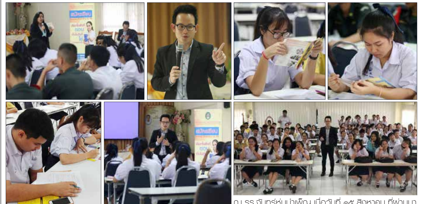
ณ รร.จันทรังษารุ่นบำเพ็ญ เมื่อวันที่ ๑๕ สิงหาคม ที่ผ่านมา