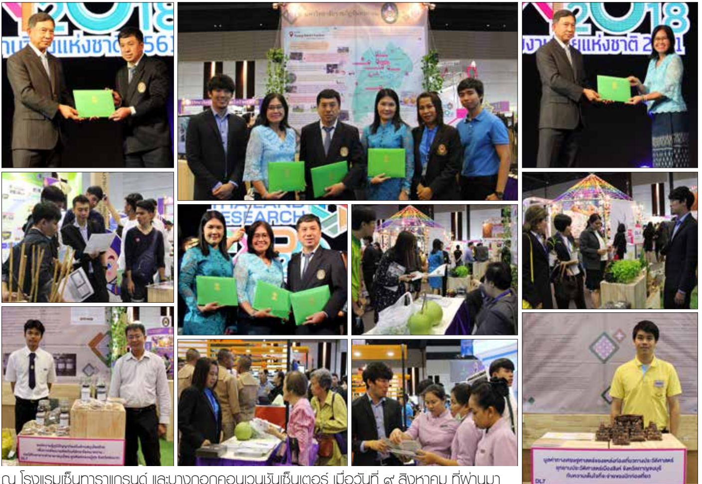
ณ โรงแรมเซ็นทาราแกรนด์ และบางกอกคอนเวนชันเซ็นเตอร์ เมื่อวันที่ ๙ สิงหาคม ที่พญาไท