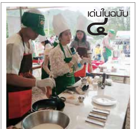
นศ.ใจ๋! รักสสคด้านอาหาร คว้รางวัลประยุกต์นุโพเพ

รวมไปถึงยังเป็นการสร้างอาชีพให้แก่คนในชุมชน โดยการสอนการแกะสลักผักและผลไม้สดให้แก่ผู้สนใจ เพื่อต่อยอดการสร้างรายได้ให้กับตนเอง” อาจารย์สายชล กล่าว