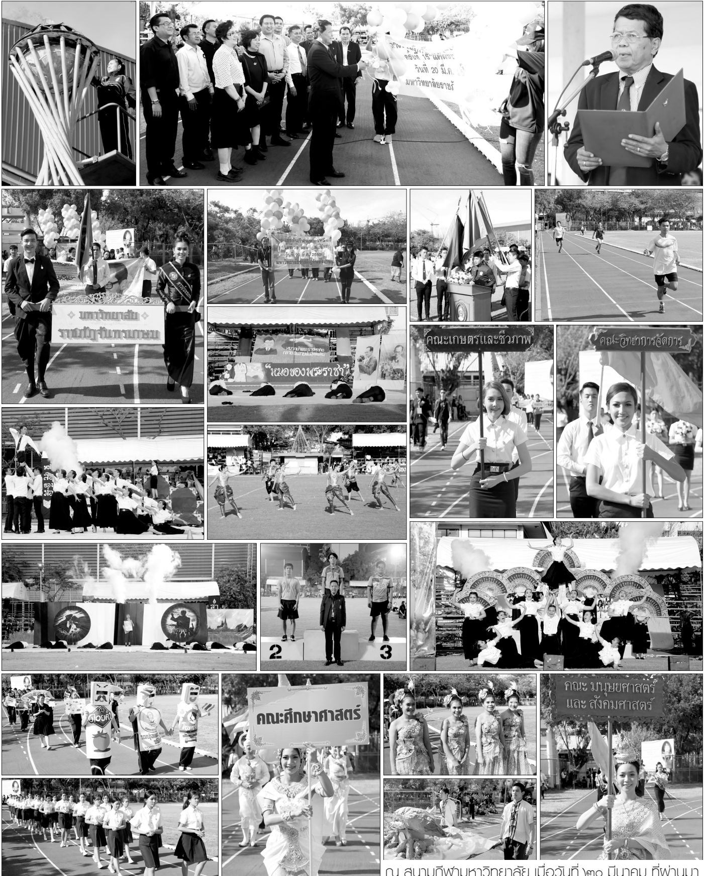
ณ สนามกีฬามหาวิทยาลัย เมื่อวันที่ ๒๐ มีนาคม ที่ผ่านมา