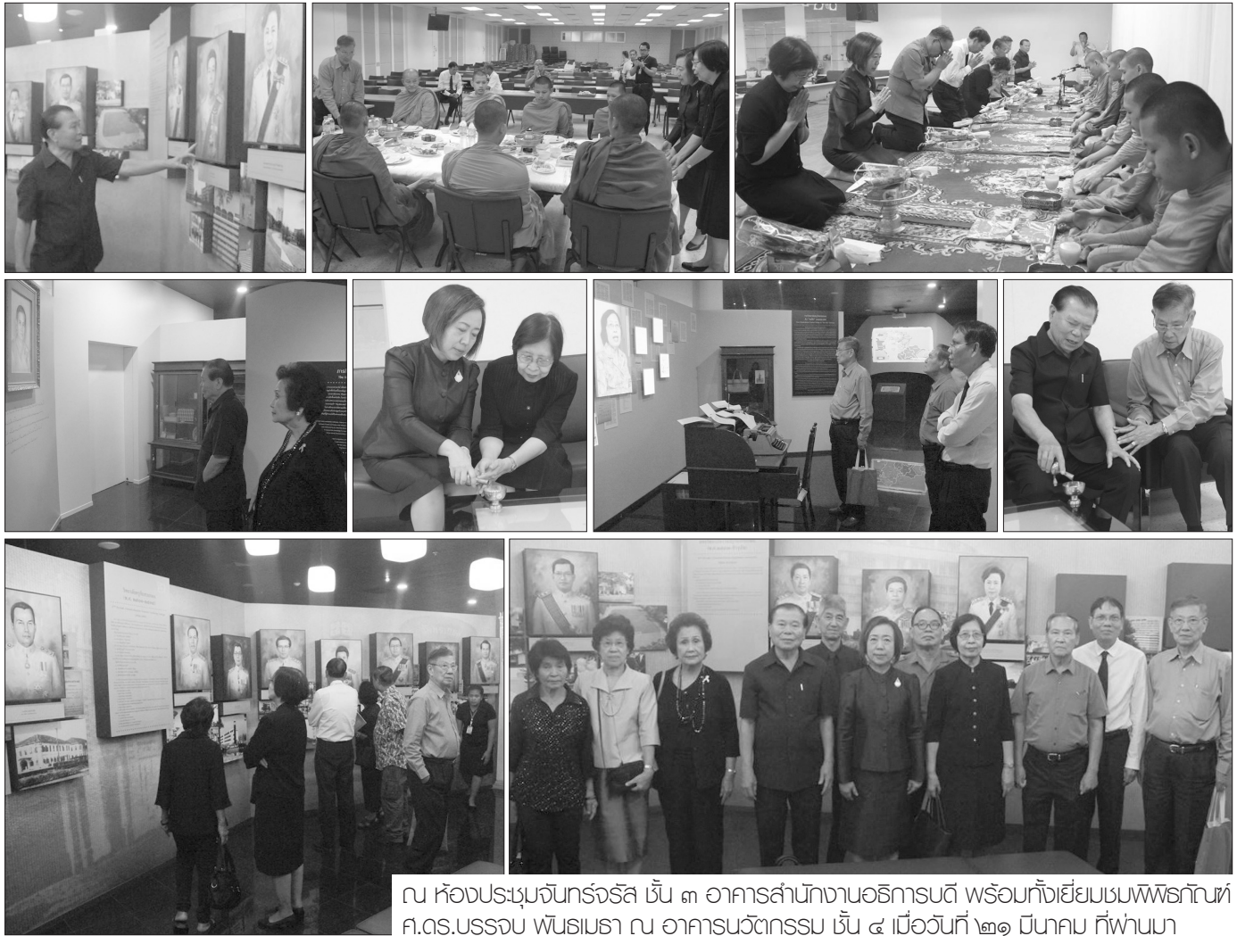
ณ ห้องประชุมจันทร์จรัส ชั้น ๓ อาคารสำนักงานอธิการบดี พร้อมทั้งเยี่ยมชมพิพิธภัณฑ์ ศ.ดร.บรรจบ พันธุเมธา ณ อาคารนวัตกรรม ชั้น ๔ เมื่อวันที่ ๒๗ มีนาคม ที่ผ่านมา