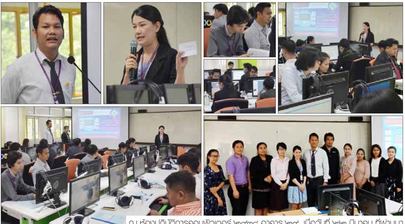
ณ ห้องปฏิบัติการคอมพิวเตอร์ ๒๕๓๘ อาคาร ๒๕ เมื่อวันที่ ๒๒ มีนาคม ที่ผ่านมา