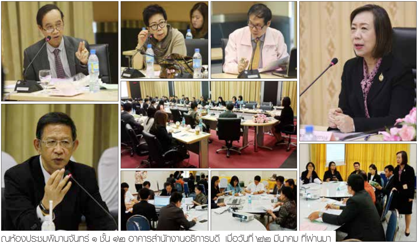
ณ ห้องประชุมพินานจันทร์ ๑ ชั้น ๑๒ อาคารสำนักงานอธิการบดี เมื่อวันที่ ๒๒ มีนาคม ที่ผ่านมา