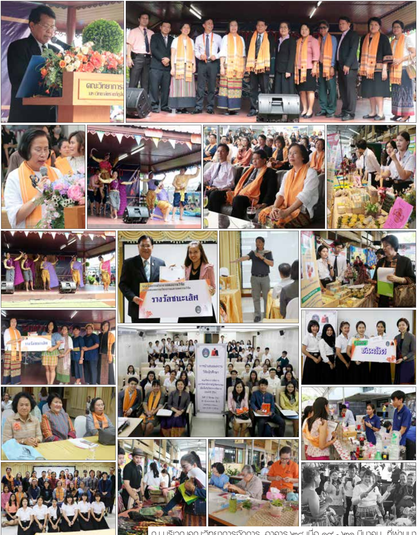
ณ บริเวณคณะวิทยาการจัดการ, อาคาร ๒๘ เมื่อ ๑๙ - ๒๑ มีนาคม ที่ผ่านมา