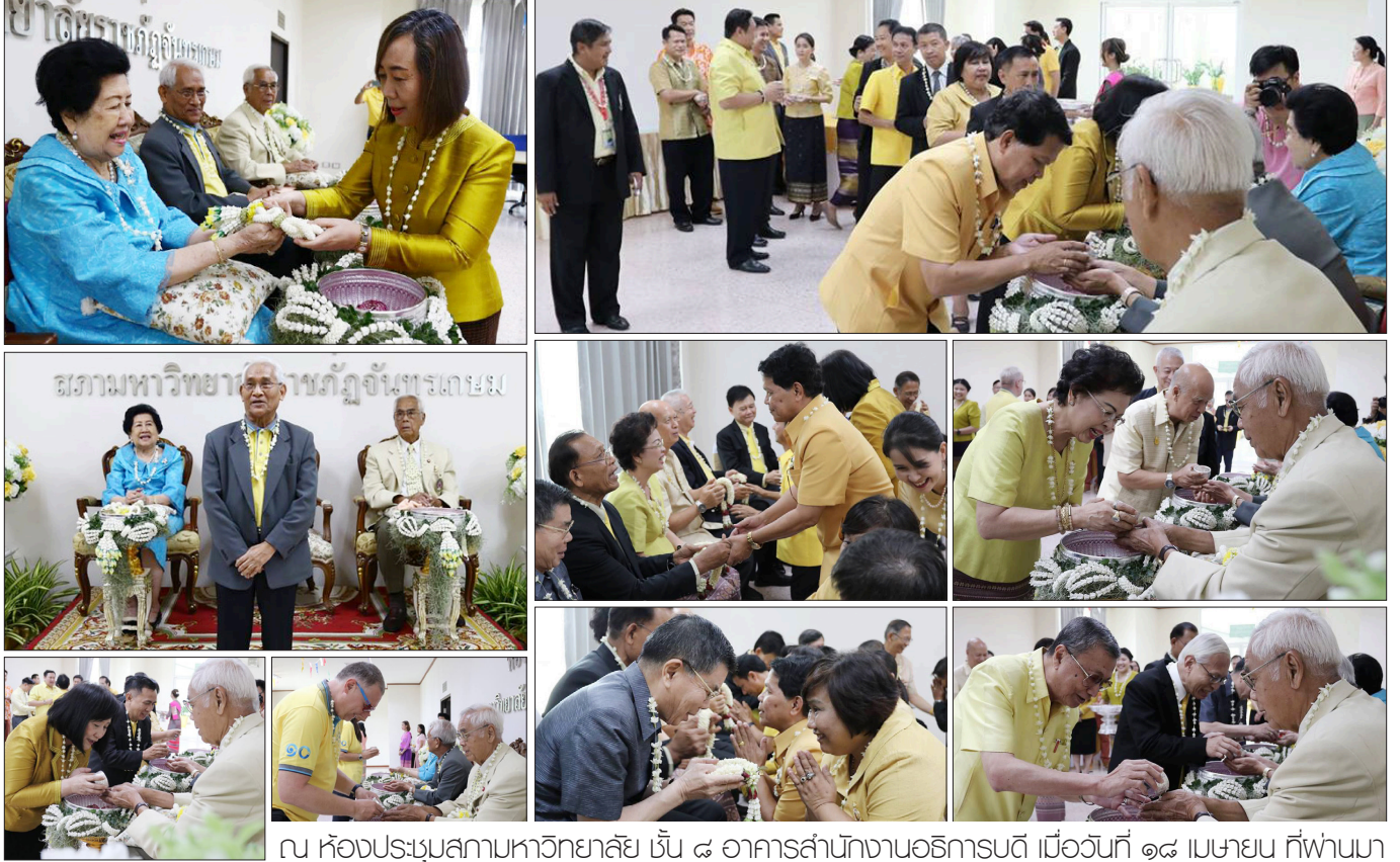
ณ ห้องประชุมสภามหาวิทยาลัย ชั้น ๘ อาคารสำนักงานอธิการบดี เมื่อวันที่ ๑๘ เมษายน ที่พวนมา