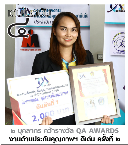
๒ บุคลากร คิวอาร์วัล QA AWARDS งานด้านประกันคุณภาพฯ ดีเด่น ครั้งที่ ๒

จันทร์เกษม ร่วมกับวัดเสมียนนารี พระอารามหลวง จัดโครงการบรรพชาอุปสมบทเฉลิมพระเกียรติ สมเด็จพระเจ้าอยู่หัวมหาวชิราลงกรณ บดินทรเทพยวรางกูร เนื่องในโอกาสมหามงคล พระราชพิธีบรมราชาภิเษก พุทธศักราช ๒๕๖๒ ระหว่างวันที่ ๓ ถึง ๑๗ พฤษภาคม ๒๕๖๒ ณ วัดเสมียนนารี พระอารามหลวง