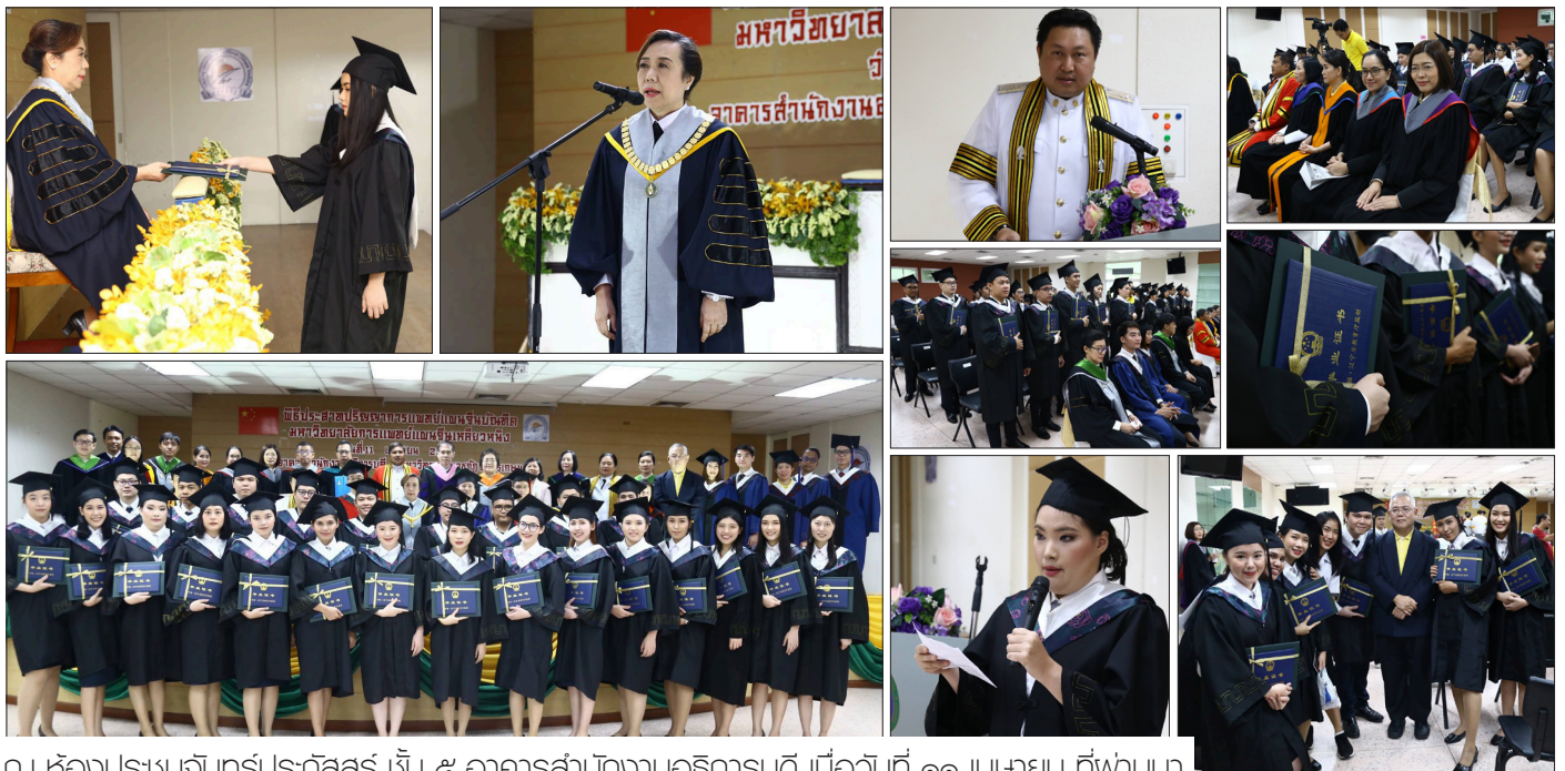
ณ ห้องประชุมจันทรประภัสร์ ชั้น ๕ อาคารสำนักงานอธิการบดี เมื่อวันที่ ๑๑ เมษายน ที่พวนมา