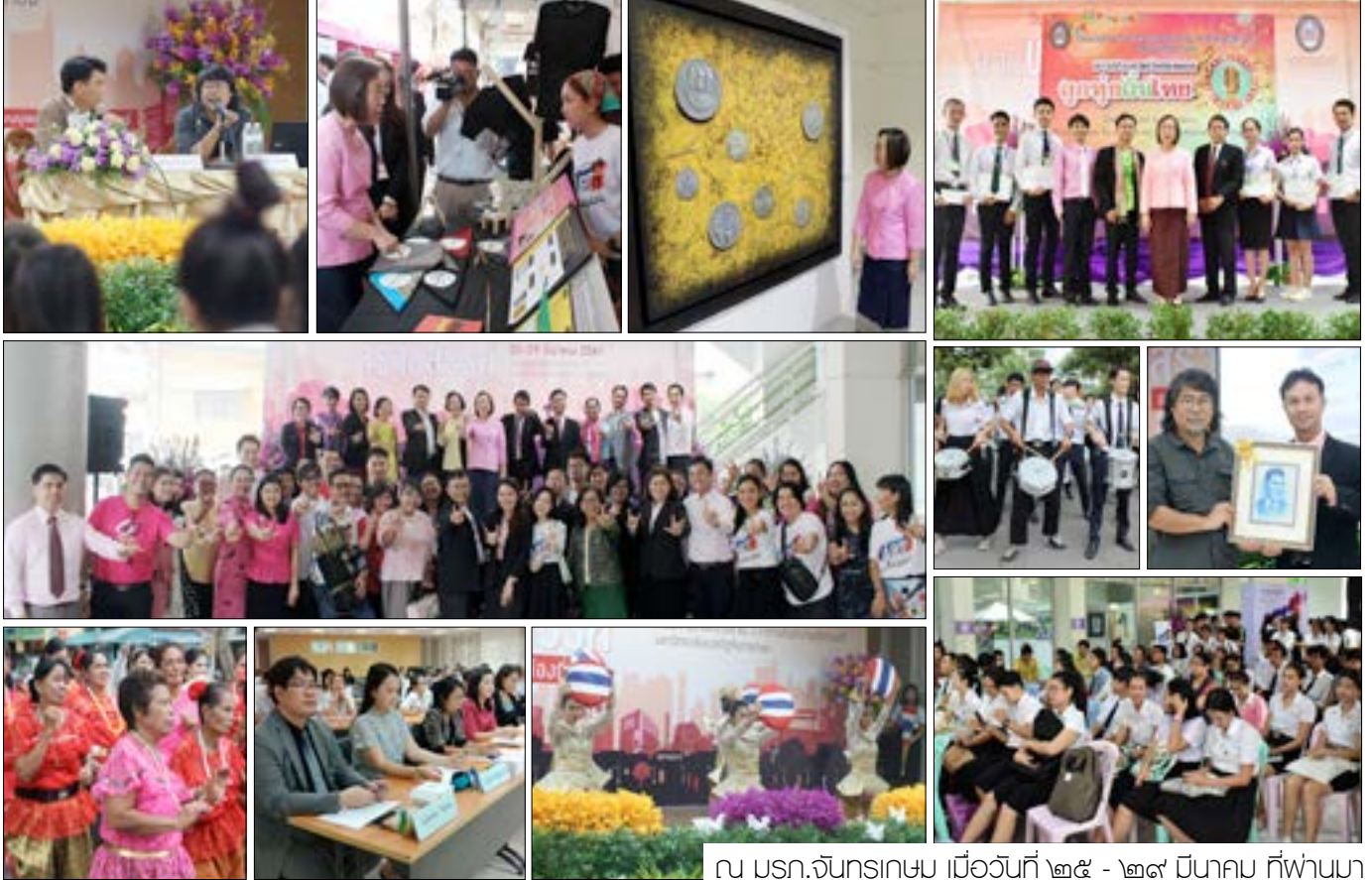
ณ มรท.จันทรเกษม เมื่อวันที่ ๒๕ - ๒๙ มีนาคม ที่ผ่านมา