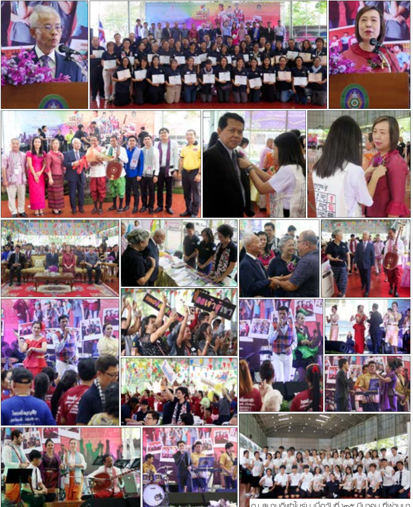
ณ สนามกีฬาในร่ม เมื่อวันที่ ๒๕ มีนาคม ที่ฟานมา