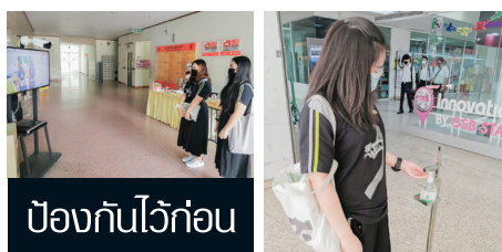
ป้องกันไว้ก่อน

โรงเรียนสาธิตมหาวิทยาลัยราชภัฏจันทรเกษม รับสมัครนักเรียนเข้าศึกษา ระดับชั้นอนุบาลและประถมศึกษา ปีการศึกษา 2564 วันที่ - วันที่ 12 ก.พ. 64 รายละเอียดเพิ่มเติมที่ โรงเรียนสาธิตมหาวิทยาลัยราชภัฏจันทรเกษม หรือ โทร. 0 2513 1358