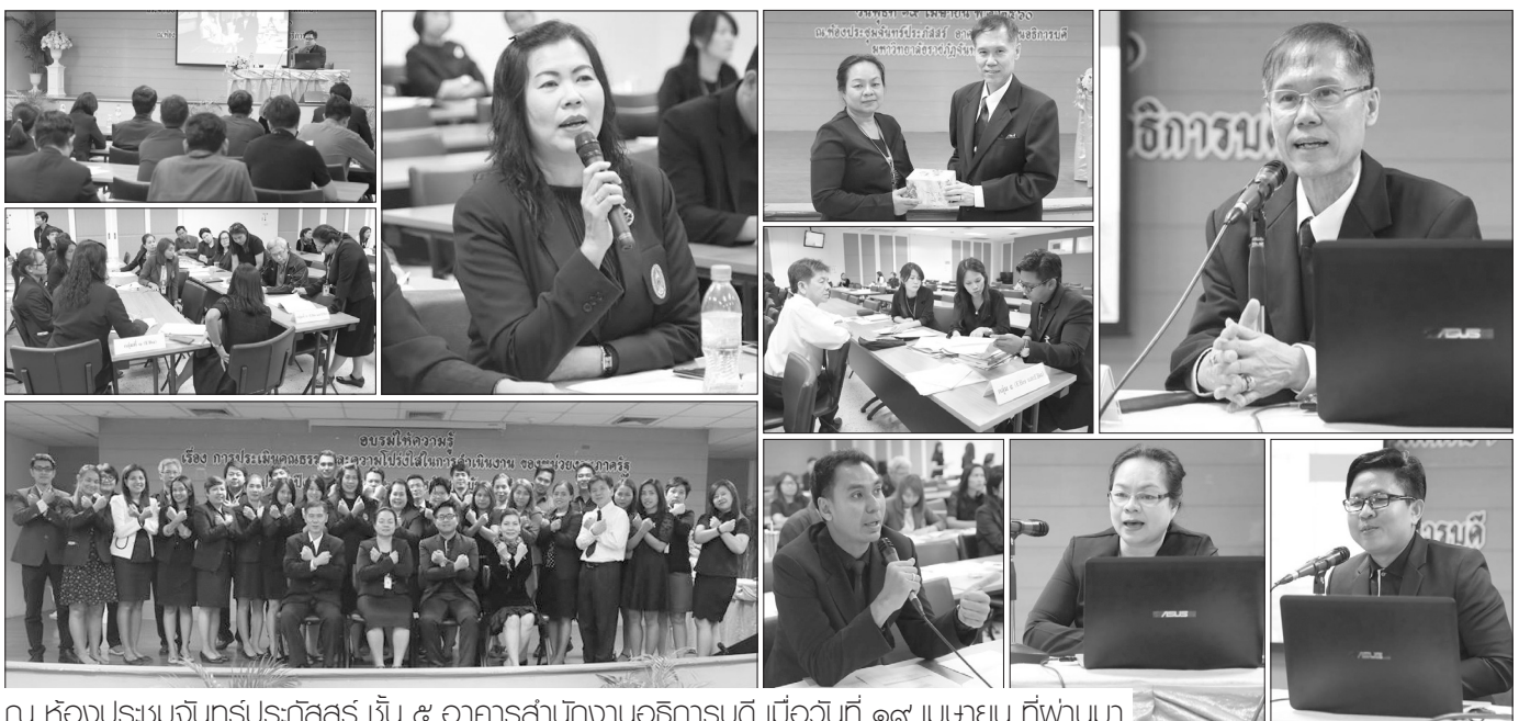
ณ ห้องประชุมจันทรกระจ่างฟ้า ชั้น ๕ อาคารสำนักงานอธิการบดี เมื่อวันที่ ๑๙ เมษายน ที่พันทมา