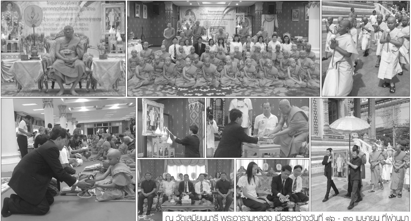
ณ วัดเสถียมนานี พระอารามหลวง เมื่อวันที่ ๑๖ - ๓๐ เมษายน ที่พันทมา