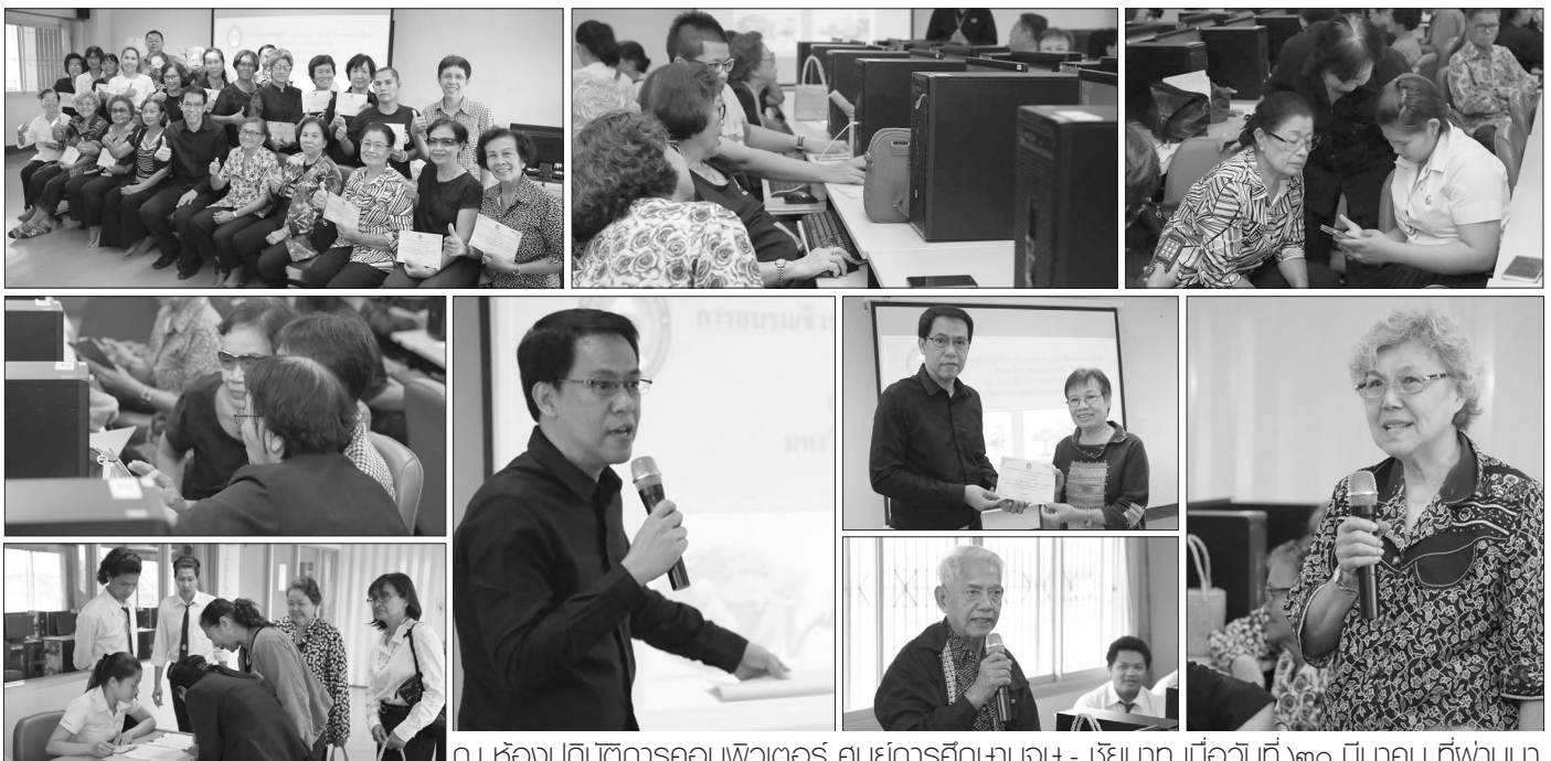
ณ ห้องปฏิบัติการคอมพิวเตอร์ ศูนย์การศึกษาอมช.- ไซยาต เมื่อวันที่ ๒๐ มีนาคม ที่ผ่านมา