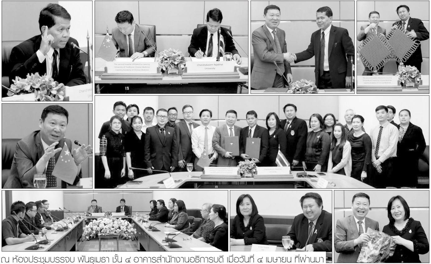
ณ ห้องประชุมบรรจบ พันธุมธา ชั้น ๔ อาคารสำนักงานอธิการบดี เมื่อวันที่ ๔ เมษายน ที่ผ่านมา