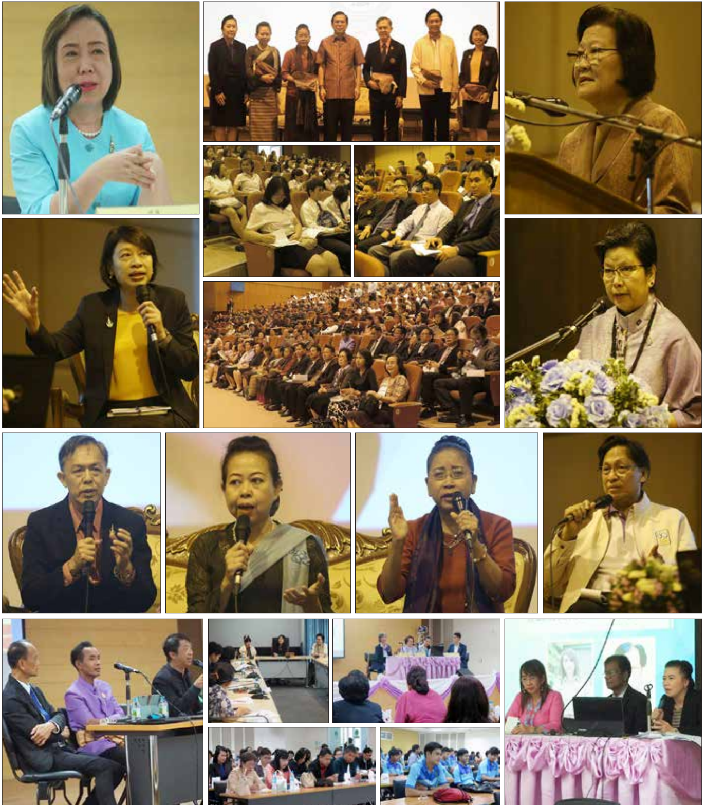
ณ ห้องประชุม ชั้น ๕ อาคารนวัตกรรมฯ และ ห้องประชุมจันทร์จรัส ชั้น ๓ อาคารสำนักงานอธิการบดี เมื่อวันที่ ๑๙ - ๒๐ เมษายน ที่ผ่านมา