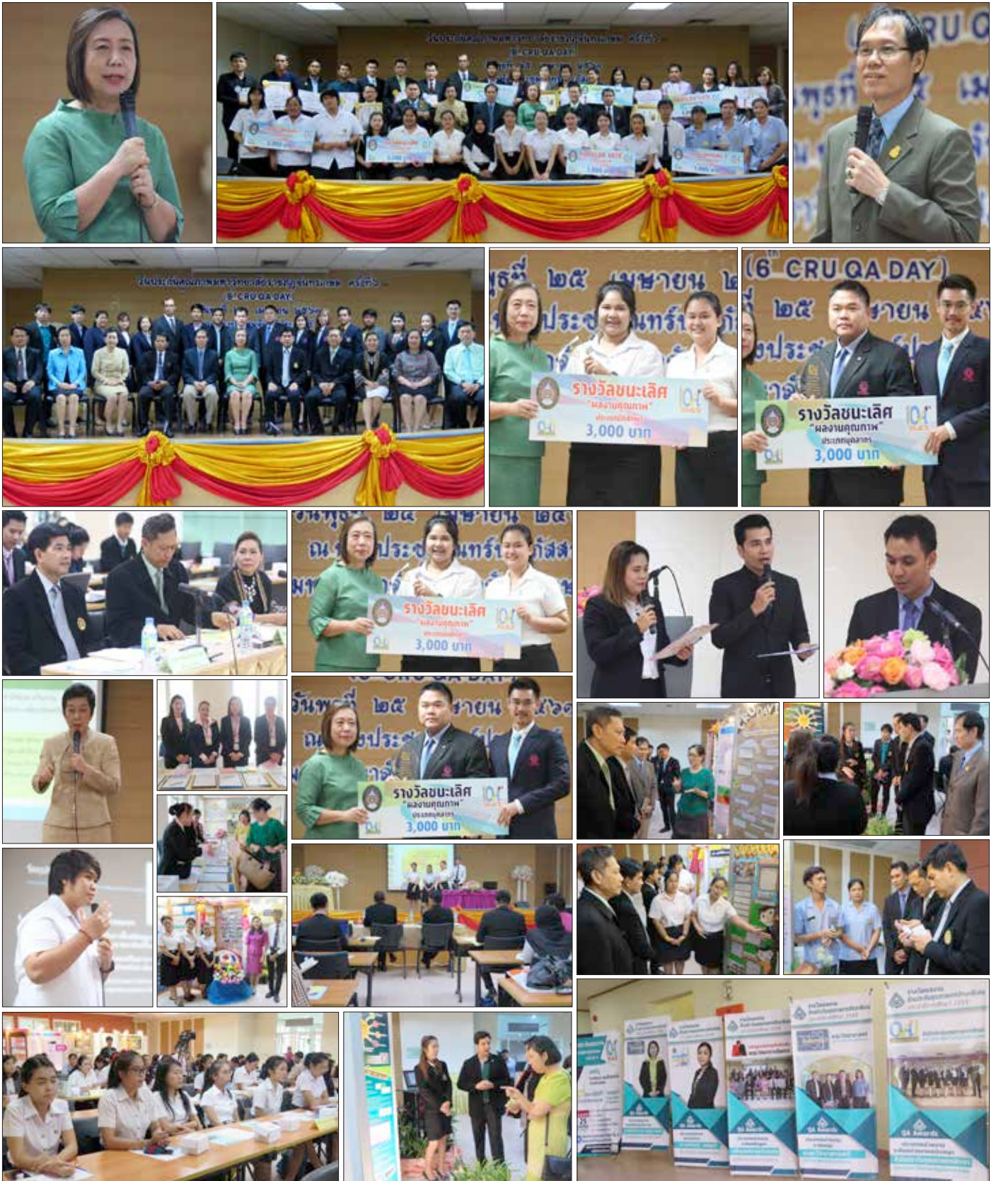
ณ ห้องประชุมจันทร์ประภัสร์ ชั้น ๕ อาคารสำนักงานอธิการบดี เมื่อวันที่ ๒๕ เมษายน ที่ผ่านมา