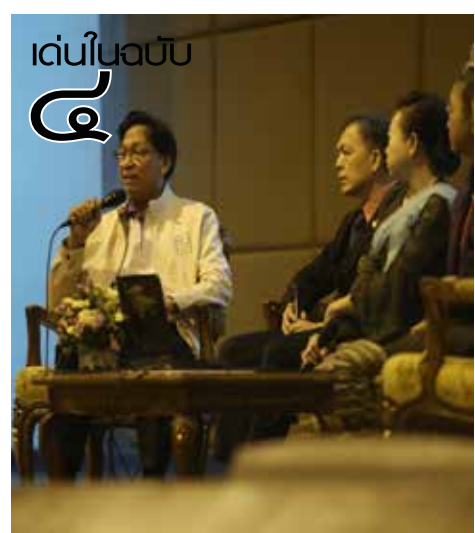
“๕ เรือจ้าง” ...สร้างคุณูปการด้านครู