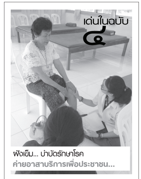
ฟังเข้ม... บำบัดรักษาโรค ค่ายอาสาบริการเพื่อประชาชน...

จากกรีฑา วิ่ง ๑,๕๐๐ เมตร และ ๕๐๐ เมตร (อายุไม่เกิน ๒๙ ปี) พุ่มน้ำหนัก (อายุ ๔๕ - ๔๙ ปี) ฟุตซอลทีมชาย และวอลเลย์บอลชาย ทั้งนี้ นักฟุตซอลของทีมจันทรเกษมยังได้รับรางวัลนักกีฬายอดเยี่ยมอีกด้วย อ่านต่อหน้า ๖