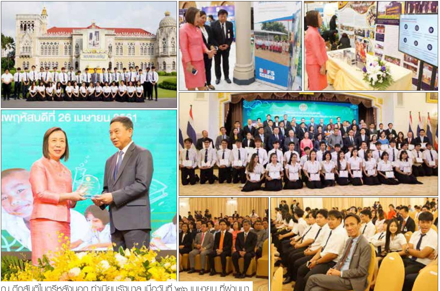
ณ ตึกสันติไมตรีหลังนอก ทำเนียบรัฐบาล เมื่อวันที่ ๒๖ เมษายน ที่พำนา