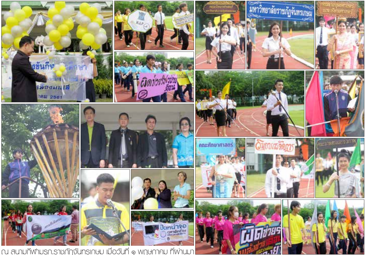
ณ สนามกีฬาบร.ราชภัฏจันทรเกษม เมื่อวันที่ ๑ พฤษภาคม ที่ผ่านม