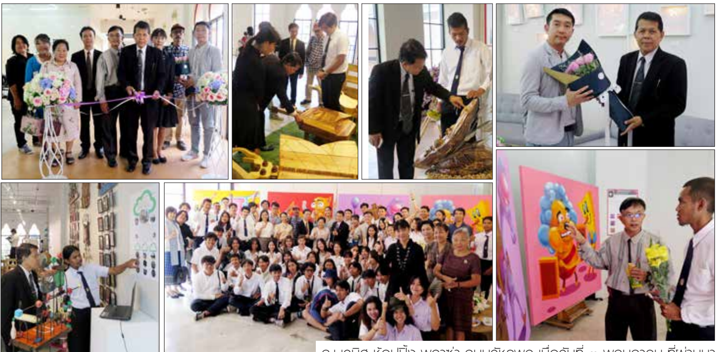
ณ เวที ชั้น ๒ อาคาร ๑๑ ถนนวิภาวดี เมื่อวันที่ ๓ พฤษภาคม ที่พำนา