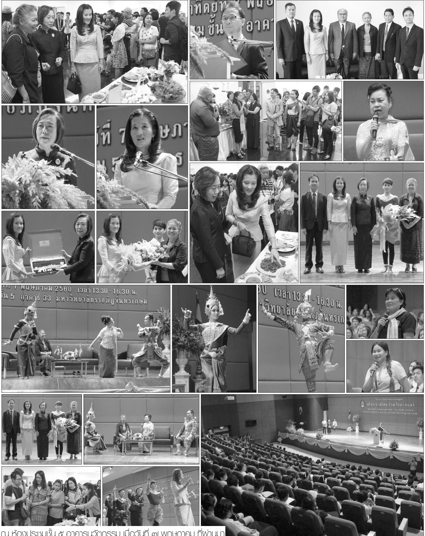
ณ ห้องประชุมชั้น ๕ อาคารนวัตกรรม เมื่อวันที่ ๗ พฤษภาคม ที่ผ่านมา