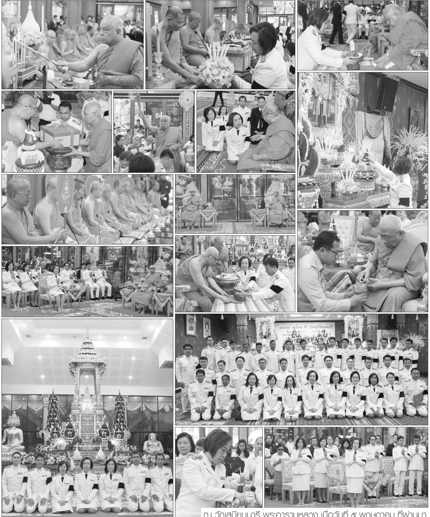
ณ วัดเสมียนนารี พระอารามหลวง เมื่อวันที่ ๕ พฤษภาคม ที่ผ่านมา